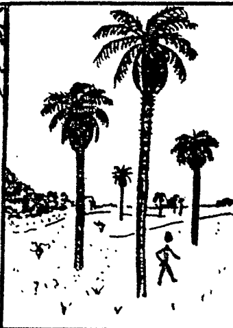
Acrocomia lasiospatha (mucaya)