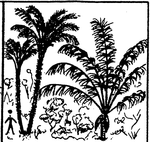
Astrocaryum vulgare (awara)