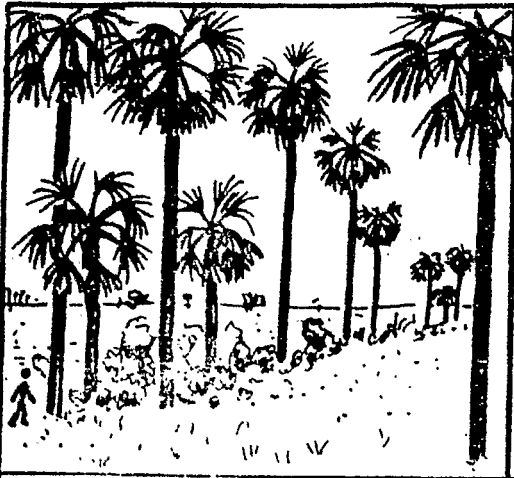
Mauritia flexuosa (palmier-bâche)