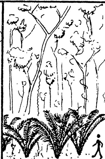
Astrocaryum paramaca (comana)