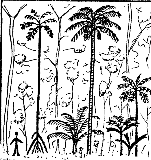
Iriartea exorrhiza (awara-mon-père)