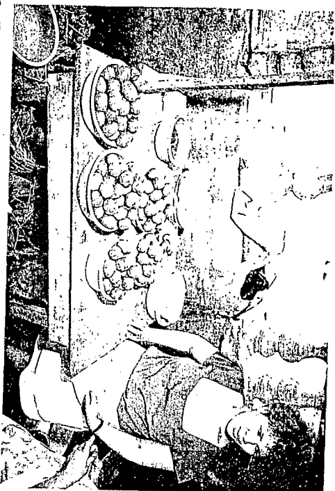
Fig. 3 : Fruit du Mauritia flexuosa , l'aguaje, vendu sur les marchés d'Iquitos.

La haute densité des peuplements de Mauritia flexuosa et leur vaste étendue en Amazonie péruvienne confèrent à cette espèce la première place parmi les palmiers indigènes d'importance économique.