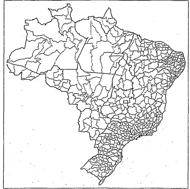
Fig. 2.— Les microrégions géographiques des années 1990 au Brésil.

1991, mais la publication des données statistiques habituelles a tardé, pour des raisons d'ordre technique liées à la mise en œuvre du logiciel de critique des données (vérification de la cohérence des réponses enregistrées par les agents recenseurs). Les principales données de cadrage (le nombre d'habitants selon le sexe et la localisation urbaine ou rurale, ainsi que le nombre de logements) n'ont été rendues publiques qu'en 1992. En 1994, les premiers tableaux basés sur les réponses aux questions composant le formulaire 1.01 du recensement démographique ont commencé à être disponibles. Malheureusement, un fâcheux retard portant sur les données de l'État amazonien du Pará a interdit toute analyse de l'ensemble national jusqu'au début de l'année 1995. Mais la « saga » n'était pas terminée pour autant, puisqu'une grande partie du recensement de 1991 n'avait pas encore été exploitée, celle qui provenait du formulaire 1.02, permettant d'analyser les conditions de vie. Et c'est seulement dans le courant de l'année 1998 que la publication de ces informations par l'IBGE a été achevée.