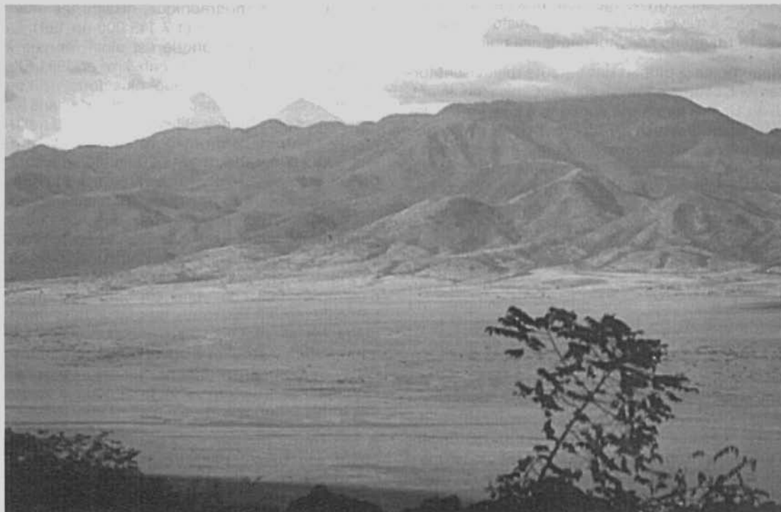
République démocratique du Congo. Le rift : graben, horsts, volcans (chaîne des Virunga).

" Les monts du Mandara, môle précambrien sou-