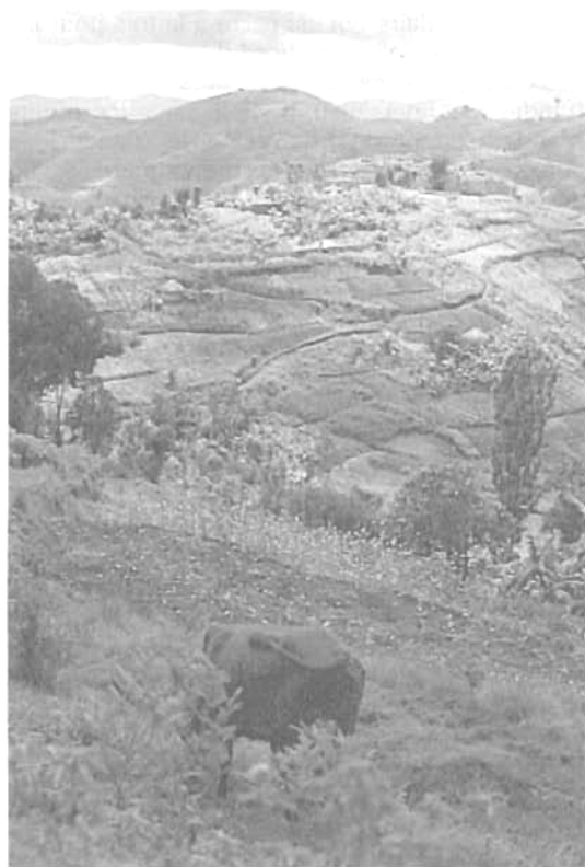
Rwanda. Terroir de montagne vers Buyenzi.

Les modèles montagnards sont multiples. Certains sont ceux de l'ingéniosité paysanne face à la nature, comme en témoignent de nombreuses descriptions du système bamiléké au Cameroun et du système chagga au Kilimandjaro. D'autres relèvent de modèles pastoraux, comme au Fouta Djallon et sur les sommets de la dorsale camerounaise. D'autres encore participent de façon plus ou moins explicite d'une idéalité de la montagne-nature, volontiers forestière, riche de faune sauvage, et refuge de populations " traditionnelles " ; le tout en voie de disparition sous les assauts de " la civilisation " : Parfois la montagne est présentée à l'aune de modèles catastrophistes, fatalement voués aux ravages des pertes de sols et de