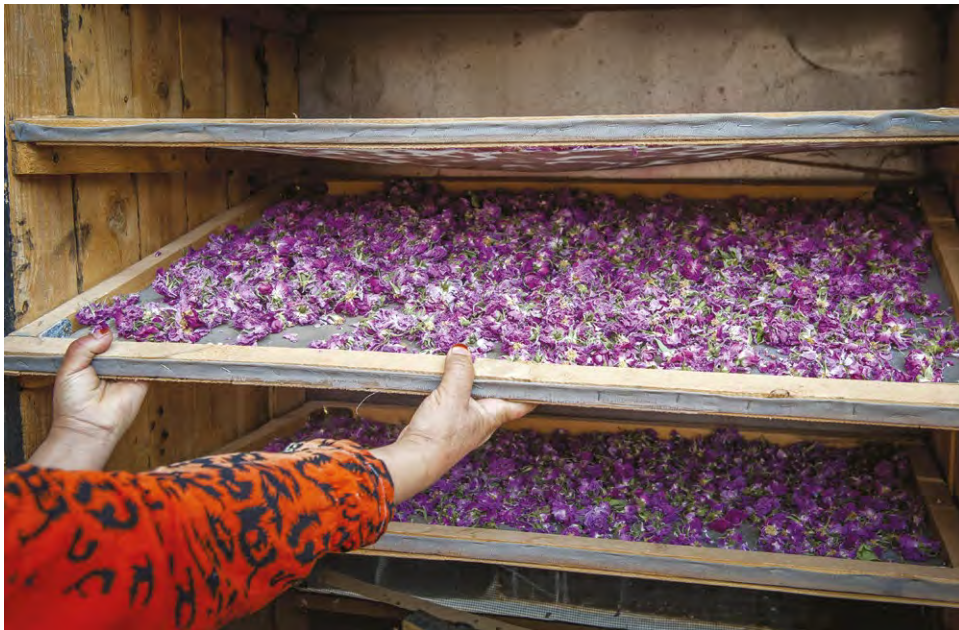
Photo 2 : séchage des pétales de rose, coopérative féminine

du tourisme et de la culture et des autorités locales et régionales. Dans le festival de la rose, devenu pour quelques jours une vitrine de tout un territoire, sont introduites de nouvelles activités (l'élection de Miss rose, le Carnaval des roses, spectacles de fantasia), et, surtout, on y convie des invités extérieurs, qui pourront témoigner de la relation entre la rose et son territoire. Au-delà de l'ancrage, on voit poindre une première forme de marketing territorial.