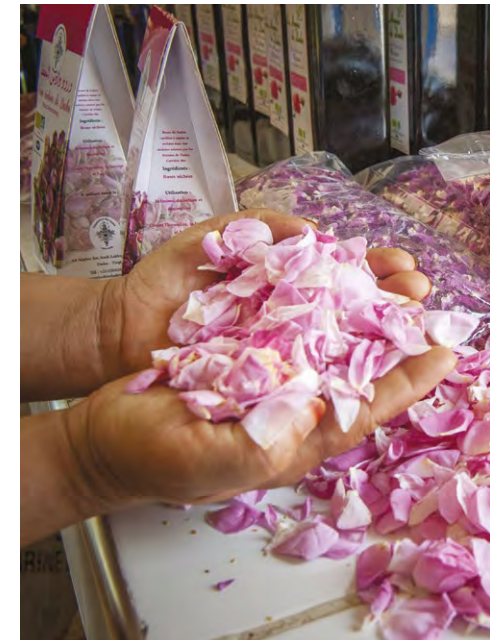
Photo 3 : pétales séchés, produits des coopératives féminines

sociétés spécialisées dans l'évènementiel. Le festival attire de plus en plus de monde, mais l'aspect culturel de la manifestation s'efface progressivement devant son attrait commercial et son côté folklorique. On n'est pas loin d'une banalisation du festival, qui ne garde pour évoquer la rose que l'élection de « Miss Rose » et le défilé des chars fleuris. La Société change de stratégie à la fin des années 90, et à la même période, une seconde usine de transformation, succursale d'une entreprise française (Biolandes) s'installe sur le territoire, ce qui permet de réintroduire de la concurrence et de ré-intéresser les producteurs à la collecte des roses. La « rose du M'Goun » réapparaît peu à peu sur le devant de la scène.