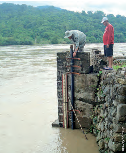
Mesures hydrauliques sur les fleuves amazoniens.