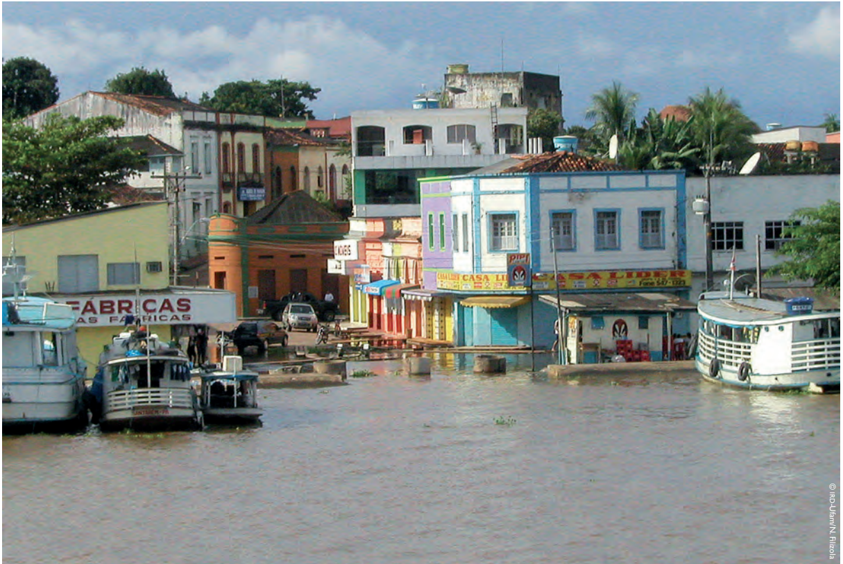
Crue de L'Amazone, Brésil.

Actuellement, l'ensemble du bassin est soumis à de fortes pressions anthropiques : déforestation, agriculture et élevage, exploitation minière légale et illégale, pollution, changements d'affectation des sols dus à l'urbanisation et à la construction de barrages... De surcroît, une accélération des événements extrêmes, inondations et sécheresses, est observée ces dernières décennies, ce qui a un impact considérable sur l'environnement et les populations de toute la région.