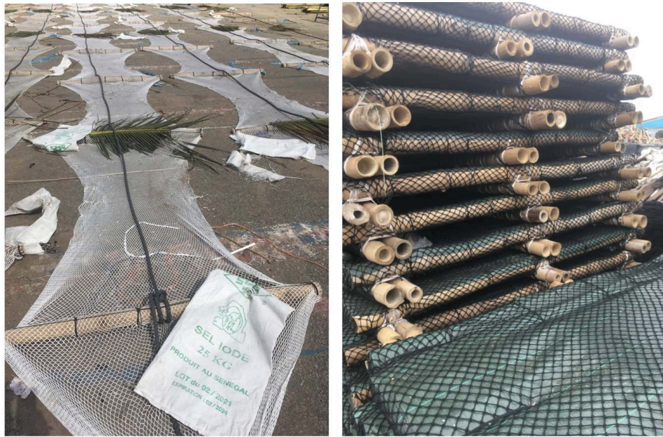
Figure 1 : Éléments d'un DCP : la traîne et le radeau

Photo de gauche : des traînes déroulées au sol, avec leurs panneaux de chute de filet blanc, tendus par des tiges de bambous auxquelles sont amarrés des sacs de sel blanc, le tout lié par un bout central noir et agrémenté de feuilles de coco.