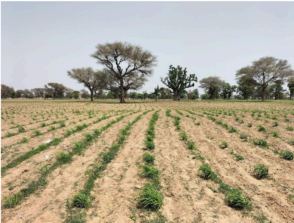
Figure 1 : Champ d'arachide dans le village de Niakhar (Fatick-Sénégal, Septembre 2022)