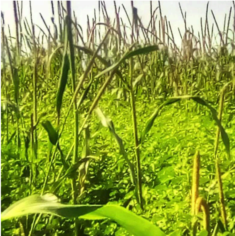
Figure 2 : Champ de Mil dans le village de Niakhar (Fatick-Sénégal, Septembre 2022)