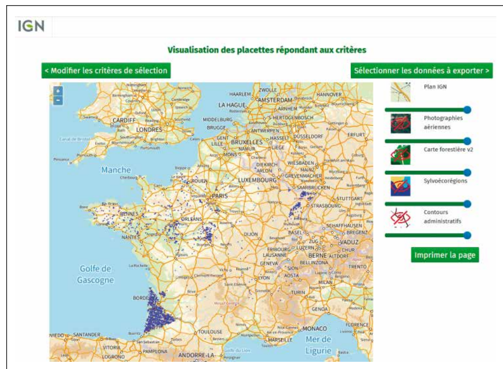
Figure 2: Podzolic plots for the surveys from 2017 to 2021 N.B. : Les coordonnées géographiques fournies sont celles du centre de la maille kilométrique de la grille d'échantillonnage la plus proche du point (les coordonnées exactes de la placette d'échantillonnage se situent à 700 mètres maximum de ce centre).

Figure 2 : Placettes à caractère podzolique pour les campagnes d'inventaire de 2017 à 2021