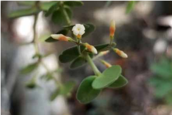
Photo 28. Alyxia aff. nummularia (Munzinger & Bruy 8300). CC-BY-NC-ND.

Résultats principaux : un probable Viotia nouveau a été récolté (photo 27) ; Citronella hirsuta récemment décrit (Munzinger & Levionnois, 2016), dont les populations connues ont été partiellement détruites par un incendie, a été retrouvé en population abondante (photo 26). Des Alyxia , genre dont la révision est en cours, ont également été rencontrés, entre autres espèces d'intérêt (photos 28 et 29). Un Cleidion proche de C. lasiophyllum a été récolté, mais nos collectes ont (entre autres caractères) des inflorescences mâles ramifiées sur toute leur longueur, un critère d'ordre spécifique selon McPherson & Tirel (1987) ; ce pourrait donc être une espèce distincte non décrite. Une nouvelle espèce de Psychotria , déjà signalée par L. Barrabé ( in herb. ), a été récoltée.