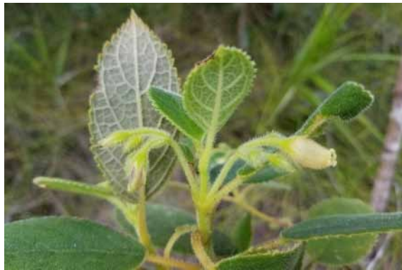
Photo 14. Coronanthera aspera (Munzinger & Bruy 8265). CC-BY-NC-ND.