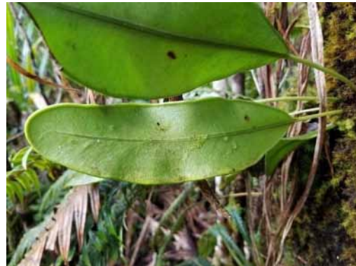
Photo 35. Elaphoglossum sp. nov. (Munzinger & Bruy 8319). CC-BY-NC-ND.