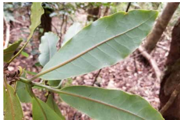
Photo 67. Litsea humboldtiana (Munzinger et al. 8400). CC-BY-NC-ND.