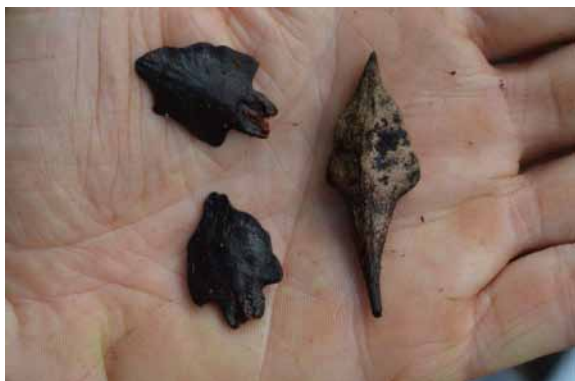
Photo 24. Goniothalamus dumontetii (Munzinger & Bruy 8286). CC-BY-NC-ND.

Empêchement : l'accès au plateau étant impossible car la piste était coupée suite au passage de la dépression tropicale, nous avons dû changer nos plans. Nous avons recherché de la forêt dans les alentours et nous sommes finalement allés dans une forêt près de Wê Kôri entre la vallée de la Koua et Kouaoua. Plusieurs espèces intéressantes y ont été observées, notamment Pandanus letocartiorum (photo 22) qui n'était pas connu aussi au sud (Callmander & Buerki, 2013) ou Goniothalamus dumontetii (photo 24) qui n'était pas signalé de ce secteur (Saunders & Munzinger, 2007). Un Meiogyne , en cours d'étude, a également été récolté (photo 23), ainsi que Ixora longiloba (photo 25), une nouvelle localité pour cette espèce.