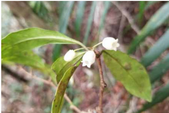
Photo 58. Periomphale balansae (Bruy & Munzinger 2342). CC-BY-NC-ND.