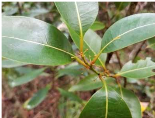
Photo 42. Litsea longipedunculata (Munzinger & Bruy 8334). CC-BY-NC-ND.