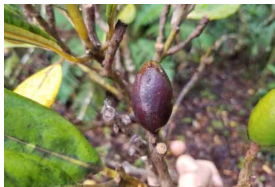
Photo 13. Endiandra sebertii (Munzinger & Bruy 8255). CC-BY-NC-ND.