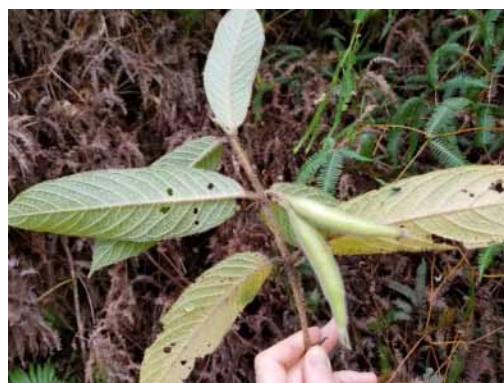
Photo 33. Atractocarpus sp. 8 (Bruy & Munzinger 2294). CC-BY-NC-ND.