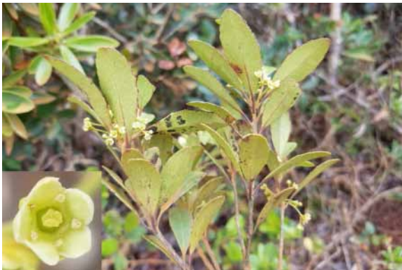
Photo 62. Denhamia fournieri subsp. drakeana (Bruy et al. 2356). CC-BY-NC-ND.