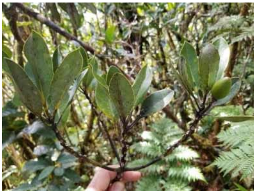
Photo 36. Endiandra sp. nov. (Ouaième) (Munzinger & Bruy 8324). CC-BY-NC-ND.