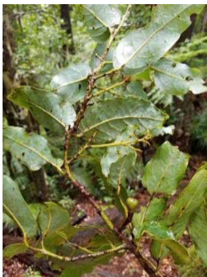
Photo 2. Cryptocarya sp. nov. (Munzinger & Bruy 8243). CC-BY-NC-ND.