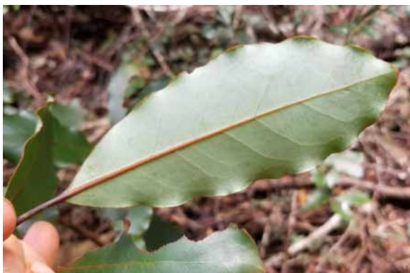
Photo 68. Endiandra sp. nov. (Fridoline) (Munzinger et al. 8376). CC-BY-NC-ND.