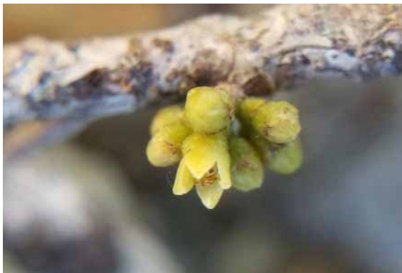
Photo 50. Geijera sp. nov. « gordonii » (Bruy & Munzinger 2334). CC-BY-NC-ND.