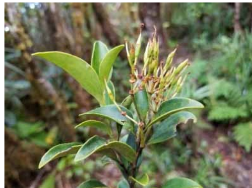
Photo 37. Stenocarpus trinervis (Munzinger & Bruy 8317). CC-BY-NC-ND.