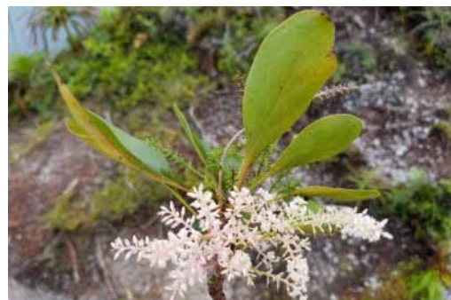
Photo 39. Beuprea crassifolia (Bruy & Munzinger 2296). CC-BY-NC-ND.