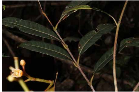
Photo 65. Euroschinus sp. (Bruy et al. 2365); G. Lannuzel, CC-BY-NC-ND.