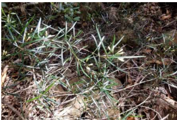
Photo 66. Psychotria sp. nov. ? (Munzinger et al. 8399). CC-BY-NC-ND.

Résultats principaux : Le Melicope nouveau a été récolté en fruits et en boutons (photo 64). L' Euroschinus a été récolté en fleurs (photo 65). Un Psychotria à feuilles linéaires a été récolté (photo 66), pour le moment celui-ci n'a pu être rattaché à aucun matériel déjà connu et pourrait être une espèce nouvelle non décrite. De la même manière, une Salicaceae ( Lasiochlamys ou Xylosma ) ne ressemblant à aucune espèce décrite (Lescot, 1980) a été récoltée. Litsea humboldtiana a été trouvée (photo 67), ce qui constitue la cinquième localité connue de cette espèce. Un Endiandra en cours de description, qui n'était connu que de la base du Koniambo et de la Tiébaghi, a été trouvé (photo 68). Cyclophyllum memaoyaense n'était connu que d'une récolte de la localité type (Mouly & Jeanson, 2015), la Oué Ponou est la seconde localité connue pour cette espèce. Une espèce nouvelle d' Acropogon à feuille composée a été collectée en fleur et en fruit.