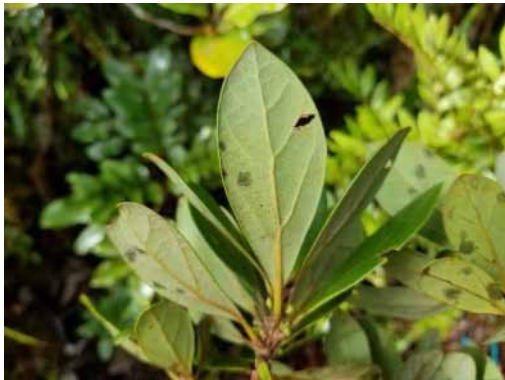
Photo 34. Litsea sp. nov. (Ouaième) (Munzinger & Bruy 8326). CC-BY-NC-ND.