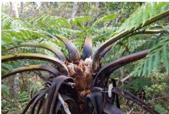
Photo 52. Dicksonia munzingeri (Munzinger & Bruy 8365). CC-BY-NC-ND.