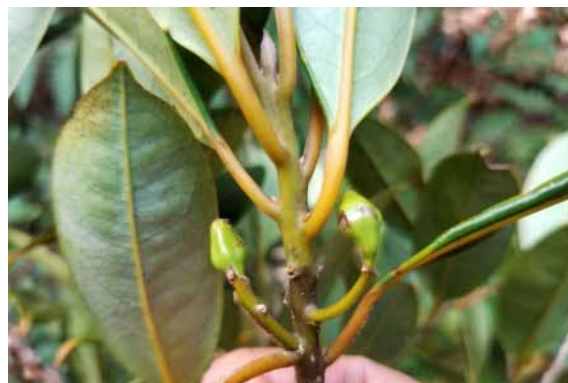
Photo 55. Cryptocarya oubatchensis (Munzinger & Bruy 8359). CC-BY-NC-ND.