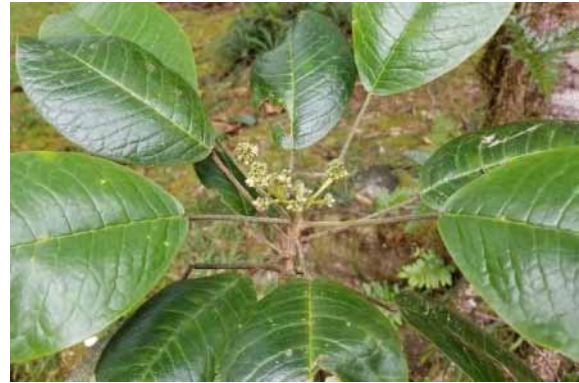
Photo 7. Sarcomelicope megistophylla (Bruy & Munzinger 2232). CC-BY-NC-ND.