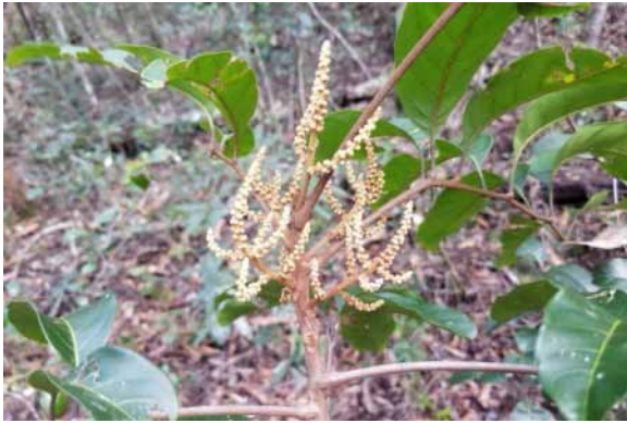
Photo 72. Cupaniopsis megalocarpa (Munzinger & Bruy 8408). CC-BY-NC-ND.