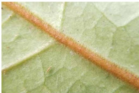
Photo 26. Citronella hirsuta (Munzinger & Bruy 8295). CC-BY-NC-ND.