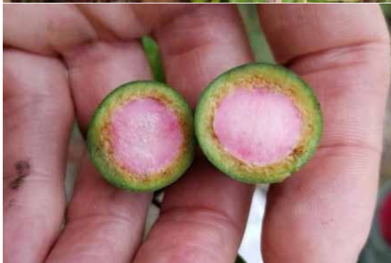
Photo 8. Endiandra baillonii (Munzinger et al. 8249). CC-BY-NC-ND.