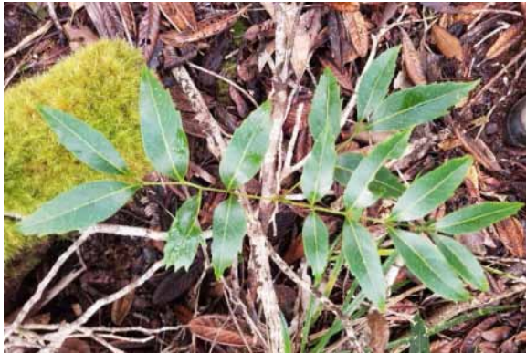
Photo 76. Lepidocupania grandiflora (Munzinger et al. 8419).

Résultats principaux : plusieurs individus de Coronanthera ont été observés et récoltés, mais ont tous été identifiés par la suite comme Coronanthera pulchra (photo 74). Dans la famille des Sapindaceae qui est à l'étude depuis plusieurs années, Lepidocupania grandiflora a été observé en fleurs et jeunes fruits et récolté (photos 75 et 76). La petite Orchidée récemment décrite Corybas echinulus (Faria, 2016) est signalée pour la première fois de cette localité (photo 77). Pycnandra montana , qui n'est connu que de cinq localités (Swenson & Munzinger, 2016), a été observé plusieurs fois en sous bois vers 800-900 m (photo 78). Chez les Lauraceae, un Litsea monocaule proche de L. ripidion a été récolté pour la première fois sur le site (photo 79).