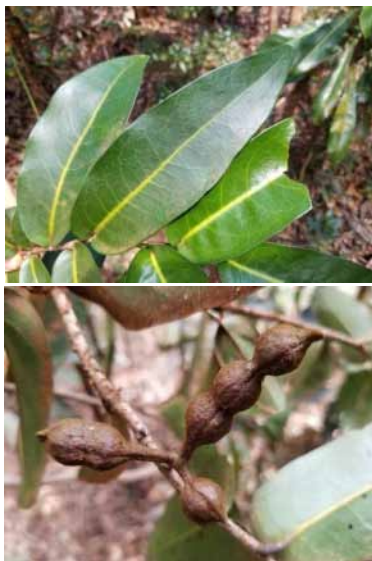
Photo 40. Meiogyne cf. sp. nov. (Munzinger & Bruy 8332). CC-BY-NC-ND.