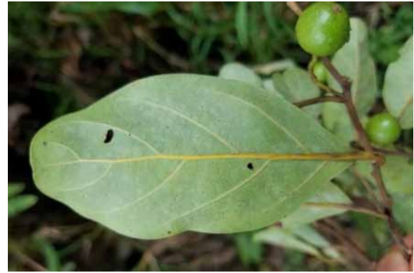
Photo 19. Cryptocarya elliptica (Munzinger & Bruy 8281). CC-BY-NC-ND.