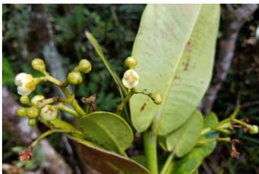
Photo 38. Garcinia ampexicaulis (Munzinger & Bruy 8321). CC-BY-NC-ND.