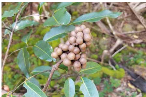
Photo 70. Alectryon sp. nov. (Munzinger & Bruy 8414). CC-BY-NC-ND.

Résultats principaux : dans la famille des Sapindaceae, qui est à l'étude depuis plusieurs années, le genre Alectryon ne comportait qu'une seule espèce, Alectryon carinatus , mais une seconde a été très récemment décrite (Munzinger et al., 2020). Une autre espèce supposée nouvelle est en cours d'étude et celle-ci a été trouvée dans la vallée, ce qui constitue une nouvelle localité et permet de compléter la connaissance de l'espèce car celle-ci était en fleurs et en jeunes fruits (photos 70 et 71). Dans la même famille, Cupaniopsis megalocarpa est signalé pour la première fois du massif (photo 72). Pandanus pancheri est signalé pour la première fois du massif (photo 73).