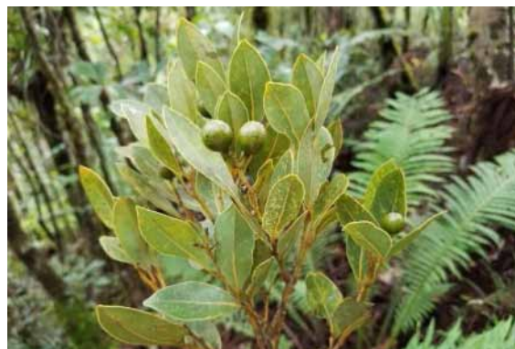
Photo 12. Cryptocarya adpressa (Munzinger & Bruy 8261). CC-BY-NC-ND.