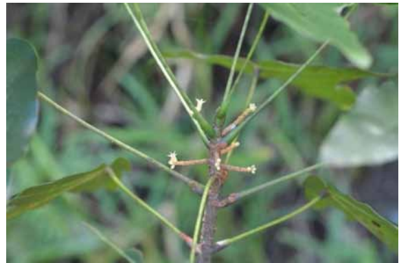
Photo 21. Acropogon horarius (Bruy & Munzinger 2272). CC-BY-NC-ND.