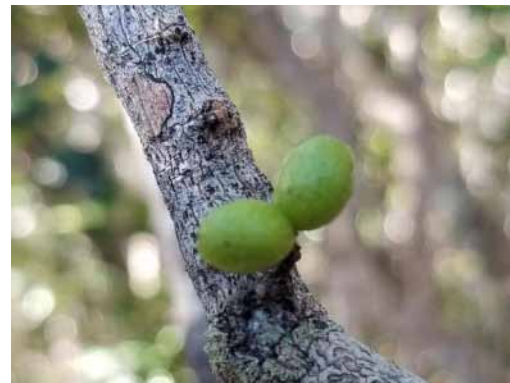
Photo 51. Geijera sp. nov. « gordonii » (Bruy & Munzinger 2335). CC-BY-NC-ND.