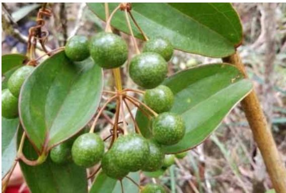
Photo 16. Smilax ssp. orbiculata (Munzinger & Bruy 8272). CC-BY-NC-ND.