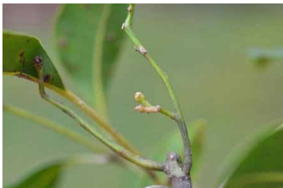
Photo 4. Burseraceae sp. nov. (Munzinger & Bruy 8246). CC-BY-NC-ND.

Résultats principaux : des individus ont été trouvés, géo-localisés et marqués à la rubalise. Seuls de très jeunes boutons et de jeunes fruits ont été observés (photos 4 et 5), la plante reste donc imparfaitement connue. Le récemment décrit Argophyllum riparium (Pillon & Hequet, 2021) a été vu en fleurs et photographié (photo 6). Sarcomelicope megistophylla est un arbre connu de quelques localités du nord-est de la Grande-Terre et du parc de la Rivière bleue. Cette localité est donc originale géographiquement et écologiquement et nous attendions de trouver des individus en fleur dans le parc pour comparer avec ceux des autres localités. C'est pourquoi cette espèce a été collectée (photo 7). Enfin une population très originale de Bocquillonia a été observée et échantillonnée près du gué de la Pourina. Les spécimens présentent une combinaison de caractères inédite pour le genre et représentent donc probablement une espèce nouvelle qui n'avait jamais été collectée auparavant. Des données supplémentaires (fleur mâles) sont néanmoins nécessaires pour confirmer ces résultats préliminaires.