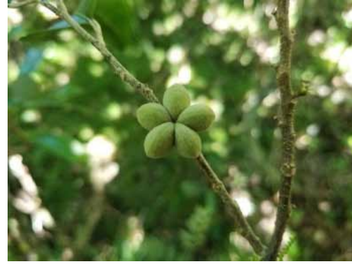
Photo 49. Geijera sp. nov. « tomentosa » (Bruy & Munzinger 2333). CC-BY-NC-ND.