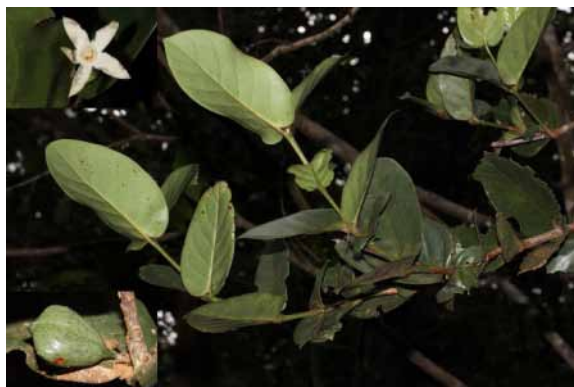
Photo 69. Cyclophyllum memaoyaense (Lannuzel et al. 607)