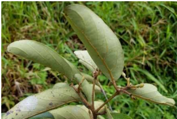
Photo 20. Cryptocarya longifolia (Munzinger & Bruy 8283). CC-BY-NC-ND.