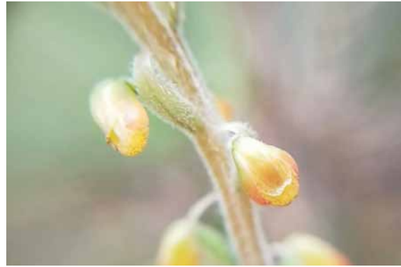
Photo 57. Gonatostylis bougainvillei (Munzinger & Bruy 8367). CC-BY-NC-ND.