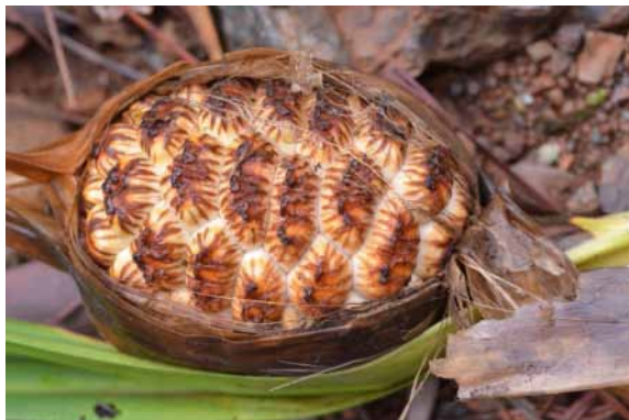
Photo 22. Pandanus letocartiorum (Munzinger & Bruy 8290).