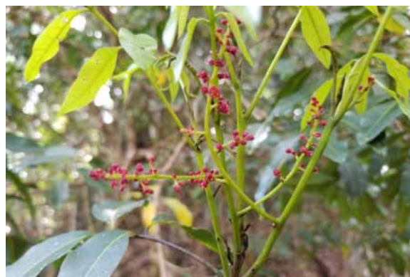
Photo 71. Alectryon sp. nov. (Munzinger & Bruy 8414). CC-BY-NC-ND.