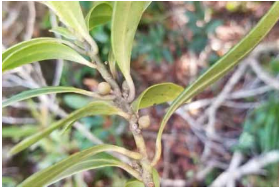
Photo 56. Myrsine memaoyaensis (Munzinger & Bruy 8372). CC-BY-NC-ND.