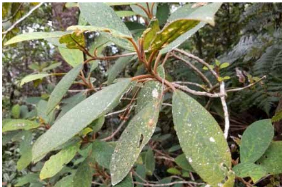
Photo 74. Coronanthera pulchra (Munzinger et al. 8421). CC-BY-NC-ND.