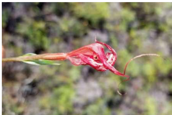
Photo 54. Pterostylis splendens (Munzinger & Bruy 8358). CC-BY-NC-ND.

Résultats principaux : la partie sommitale du massif a été explorée. La population type d' Endiandra neocaledonica a été retrouvée et pourra être séquencée. Cryptocarya oubatchensis , essentiellement sur substrat non ultramafique, a été récolté (photo 55), car cette population est la plus méridionale et se distingue par ce substrat. La fougère arborescente Dicksonia munzingeri est signalée pour la première fois de ce massif (Noben & Lehnert, 2013). Comptonella drupacea a été récolté dans le cadre de la révision des Rutaceae. Plusieurs Orchidées ont été observées et récoltées (photo 54), donnant de nouvelles localités dans le cadre du projet d'atlas des Orchidées de Nouvelle-Calédonie (Pignal et al. , in prep. ).