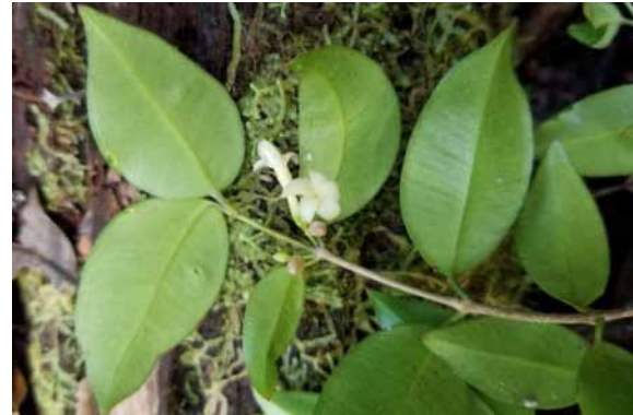
Photo 29. Alyxia cylindrocarpa (Munzinger & Bruy 8294). CC-BY-NC-ND.