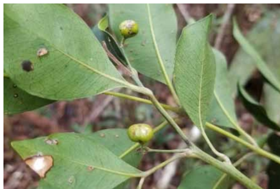
Photo 5. Burseraceae sp. nov. (Munzinger & Bruy 8246). CC-BY-NC-ND.