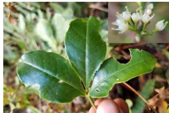
Photo 53. Comptonella drupacea (Munzinger & Bruy 8363). CC-BY-NC-ND.