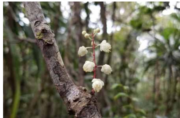
Photo 75. Lepidocupania grandiflora (Munzinger et al. 8419). CC-BY-NC-ND.

Mont Do, 28 avril 2022 (J. Munzinger, G. Lannuzel, L. Pouget)