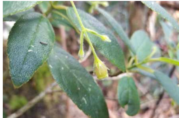
Photo 59. Coronanthera aspera (Munzinger & Bruy 8368). CC-BY-NC-ND.