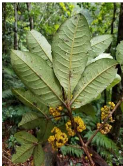
Photo 3. Comptonella sessilifoliola (Munzinger & Bruy 8244). CC-BY-NC-ND.