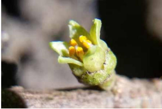
Photo 48. Geijera sp. nov. « tomentosa » (Bruy & Munzinger 2332). CC-BY-NC-ND.