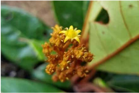
Photo 6. Argophyllum riparium (Bruy & Munzinger 2231). CC-BY-NC-ND.