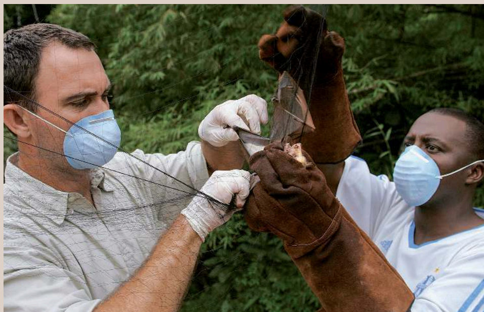
Campagne de capture de chauves-souris au Congo pour la recherche du réservoir du virus Ebola.