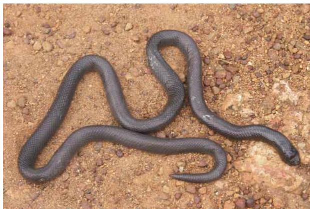
Figure 2 – Atractaspis aterrima . Spécimen de Sérissou (Guinée).

Dix-sept spécimens ont été étudiés, dont 14 du Sénégal et trois du Mali (Tableau II). Sept spécimens (41,2 %) présentaient une proie dans leur tube digestif. Dans les cinq cas où la proie était identifiable (35,7%) il s'agissait de reptiles, dont trois cas de Typhlopides ( Afrotyphlops lineolatus Jan, 1863, dans deux cas et Afrotyphlops sp. dans un cas) et deux cas de lézards indéterminés pour lesquels il ne restait que quelques griffes ou écailles non digérées.