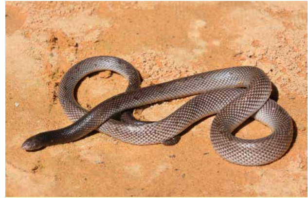
Figure 5 – Atractaspis micropholis . Spécimen de Kayar (Sénégal).

Les lézards identifiables étaient dans dix cas le Lacertidé Latastia longicaudata et dans un cas le Varanidé Varanus exanthematicus (Bosc, 1792).