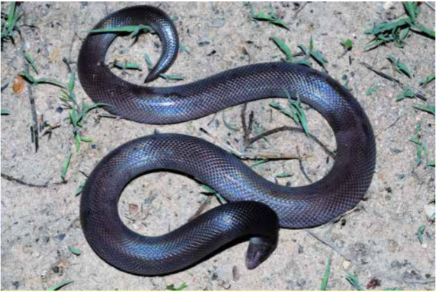
Figure 3 – Atractaspis dahomeyensis . Spécimen de Baïbokoum (Tchad).

Quatorze spécimens ont été étudiés, dont six provenaient du Mali, quatre du Togo et quatre du Tchad (Tableau III). Quatre spécimens (28,6%) présentaient une ou plusieurs proies dans leur tube digestif, mais celles-ci n'étaient identifiables que chez trois spécimens (21,4%). Un spécimen du Togo présentait un œuf de reptile, probablement un œuf de serpent, de 5,2 cm de long. Un autre spécimen du Togo présentait à la fois un œuf de reptile de 3,6 cm de long et un spécimen nouveau-né du Colubridé Philothamnus irregularis (Leach, 1819). Enfin, un spécimen du Tchad avait ingurgité un amphibien.