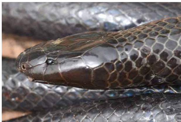
Figure 1 - Amblyodipsas unicolor . Spécimen de Moïssala (Tchad).

Dix-huit spécimens ont été étudiés, dont dix du Sénégal, quatre du Mali, trois du Tchad et un du Bénin (Tableau I). Huit spécimens (44,4 %) présentaient une ou plusieurs proies dans leur tube digestif. Pour les sept cas (38,9 %) où la proie était identifiable, il s'agissait de reptiles dans quatre cas (57,1 %) et d'amphibiens dans trois cas (42,9 %). Les reptiles étaient représentés par un serpent Typhlopide (écailles d' Afrotyphlops sp.), un amphibène ( Cynisca leucura Duméril & Bibron, 1839) et deux lézards indéterminés dont il ne restait que quelques griffes et écailles non digérées.