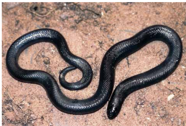
Figure 4 - Atractaspis microlepidota . Spécimen de Dielmo (Sénégal).

Onze spécimens ont été étudiés, tous provenant du Sénégal (Tableau IV). Sept spécimens (63,6 %) présentaient une proie dans leur tube digestif, mais celle-ci n'était identifiable que chez cinq spécimens (45,5%). Dans trois cas il s'agissait de crapauds Sclerophrys xeros , dans un cas du serpent Psammophis afroccidentalis Trape, Böhme & Mediannikov, 2019, ce dernier plus long que son prédateur, et dans un cas du Lacertidé Latastia longicaudata (Reuss, 1834).