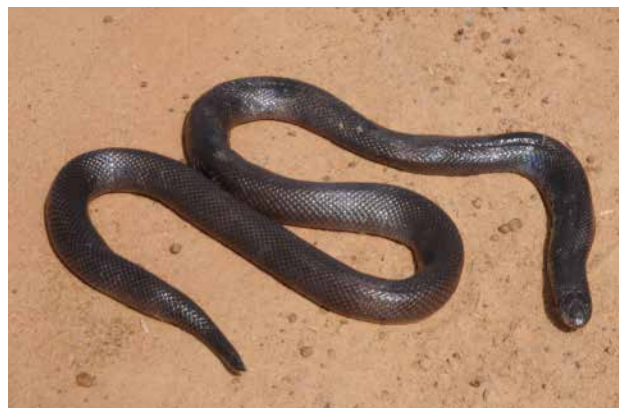
Figure 6 - Atractaspis watsoni . Spécimen de Balani (Tchad).