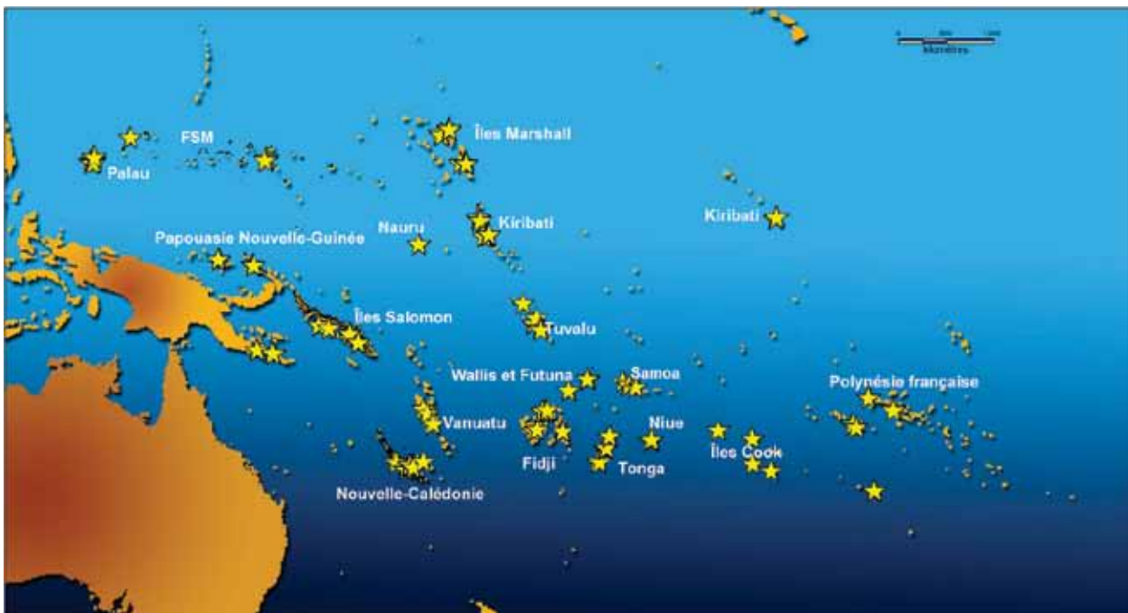
Figure 1. Localisation des données disponibles dans le cadre des projets PROCFish et CoFish.

Si la diversité phylogénétique des communautés est reconnue pour sa valeur patrimoniale incontournable, car elle illustre une “ partie ” de l'arbre de vie, la diversité fonctionnelle des écosystèmes a longtemps été négligée dans les études d'impact. Or, la richesse d'un écosystème se mesure aussi bien en termes de diversité taxonomique (nombre d'espèces différentes) qu'en diversité de lignées ou de fonctions qui assurent de nombreux biens et services écosystémiques 2 .