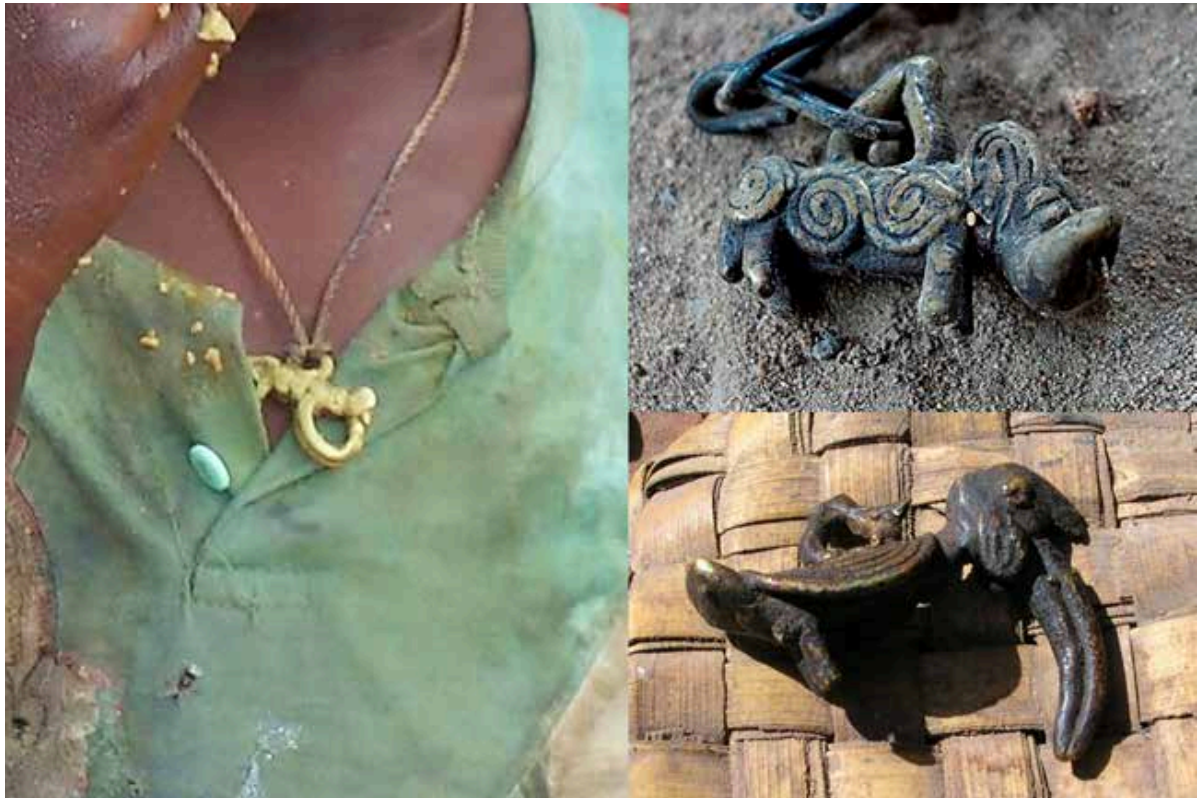
Figure 1 - Exemples de pendentifs de génies-animaux mon nuon

Source : à gauche : pendentif de panthère porté par un jeune enfant (Orodara 2015) ; à droite : en haut, pendentif de phacochère de monsieur Kine Barro (Orodara, 2017) ; en bas : pendentif de calao montré par monsieur Konaté Koin (Bandougou 2010).