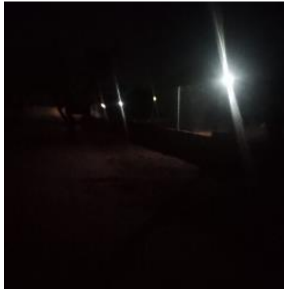
Photo 22 La clôture de la forêt le jour et la nuit