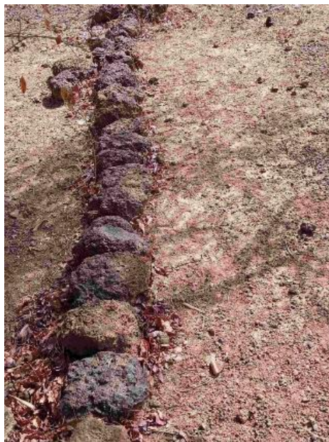
Photo 6 Ligne de cordon pierreux constitué d'une seule couche de moellons (méthode des parents de Yakouba)

Si vous faites une ligne droite de cordon pierreux, dès les premières pluies, votre construction sera détruite par l'eau car en ce moment vous donnez l'occasion à l'eau de frapper avec sa force à un même niveau (point le plus bas) et au même moment. Par contre, si vous faites le cordon en faisant des courbes de niveau, vous verrez qu'il est efficace.