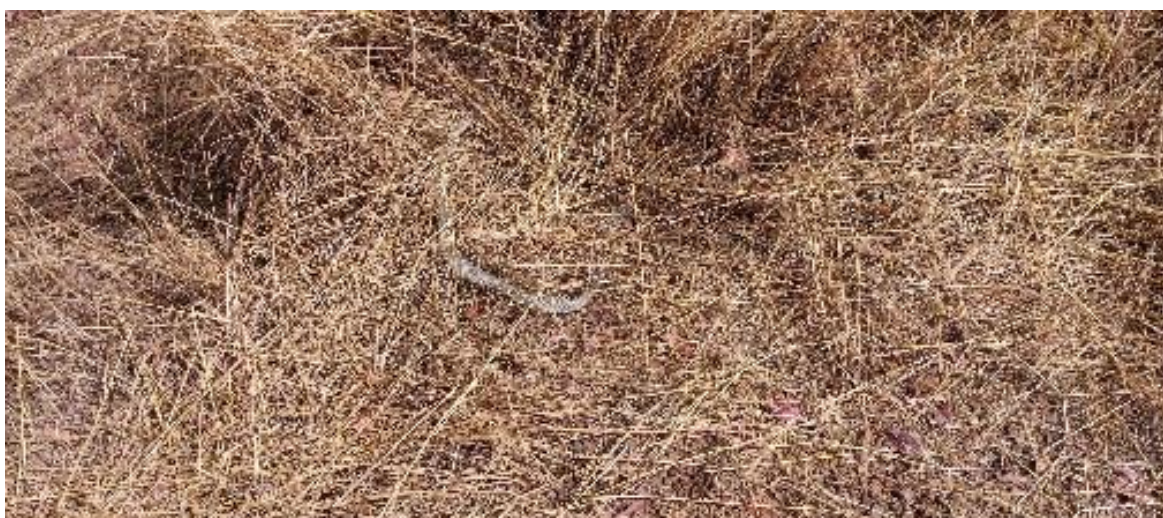
Photo 24 Mue de serpent rencontrée à Bangre Raaga