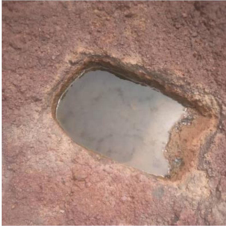
Photo 15 Abreuvoir en saison pluvieuse