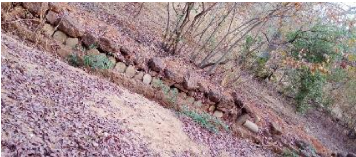
Photo 9 Une tranchée en amont d'un cordon pierreux