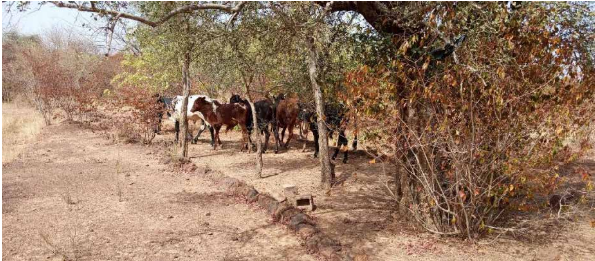
Photo 14 Animaux en pâture dans la forêt en saison sèche

Dans les champs, s'il y a des arbres qui vont gêner l'évolution des cultures, il faut les élaguer pour permettre aux cultures de bien se développer.