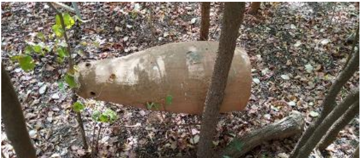
Photo 18 Ruche traditionnelle