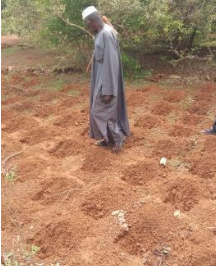
Photo 2 : Trous de zaï : profondeur ; 10 à 15 cm, diamètre : 20 à 25 cm, écartement entre trou ; 25 à 30 cm ; écartement entre lignes : 30 à 40 cm

Mes champs n'étaient pas en bon état. Sans zaï, on ne récolte pas grand-chose sur ce type de terrain. Pour produire, je n'avais pas d'autre choix que de faire du zaï. Aussi, je me suis investi dans le creusage du zaï et la réalisation de cordons pierreux. Le zaï m'a permis d'infiltrer et de conserver le maximum d'eau pour le bien être des plantes et des cultures. Sur le même champ, dans les trous sans plantules d'arbres, le zaï est recreusé l'année suivante (et on remet le même vieux fumier du trou et un peu de fumier neuf). Si un arbre a poussé, on creuse un autre trou à côté.