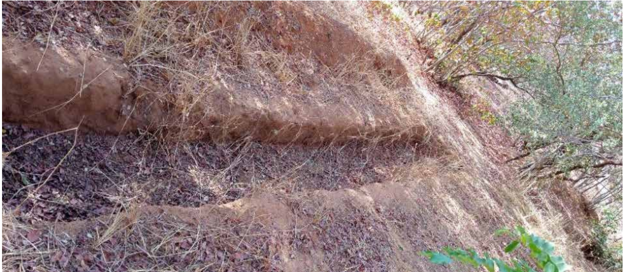
Photo 8 Une tranchée d'infiltration