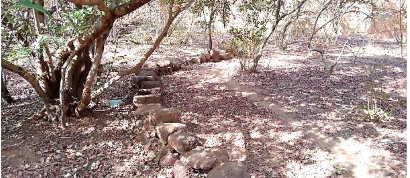
Photo 7 Cordon pierreux à trois moellons (méthode vulgarisée par FEER)