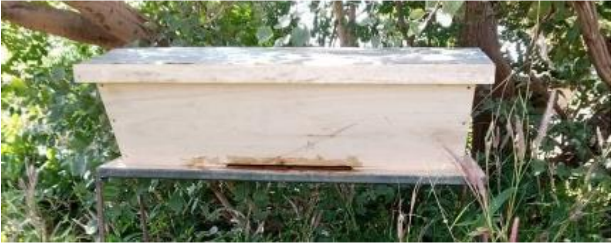
Photo 19 Ruche kenyane