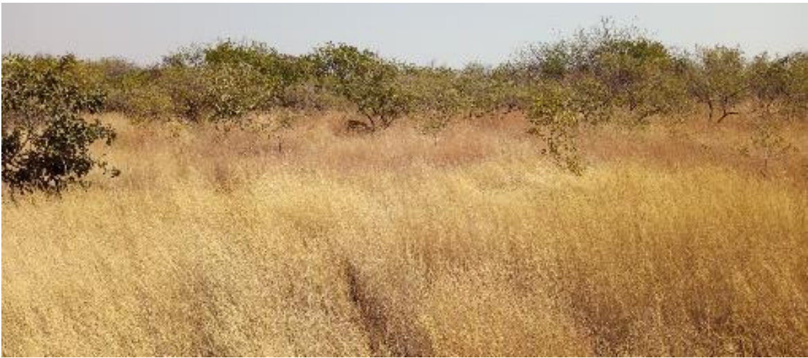
Photo 26 Zone de reproduction des lièvres