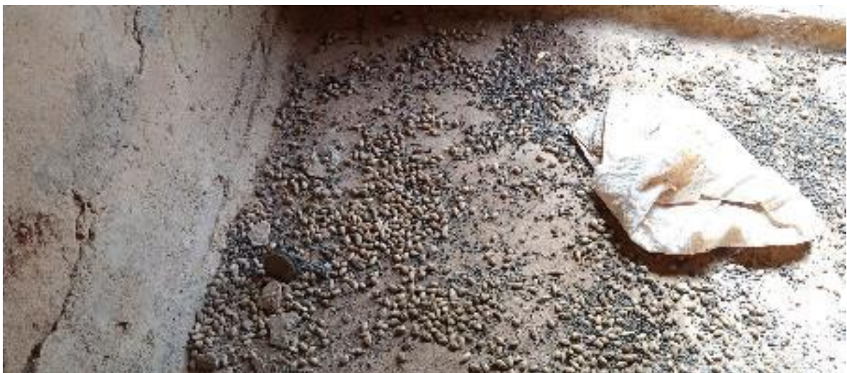
Photo 12 Graines de Balanites aegyptiaca

Le terrain est sec. Les essences comme les manguiers ( mangui tiissé ) et Gmelina n'ont pas résisté. J'ai beau avoir mis du fumier, du compost et arrosé ils finissent par s'assécher et par mourir. Par contre, à côté du domicile familial, j'ai réussi à faire grandir des manguiers. Et cela a été possible car, il y a un puits qui ne tarit pas juste à côté. Ces arbres ne manquent pas d'eau. Alors qu'en forêt, il y a des puits mais qui tarissent à un moment donné. »