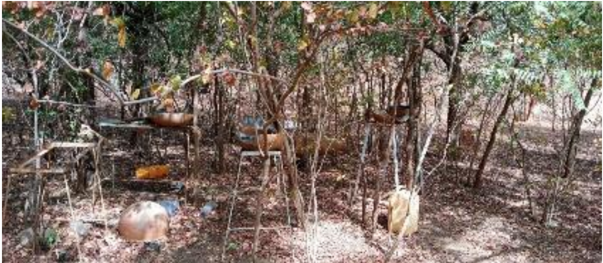
Photo 17 Abreuvoir du rucher

Les abeilles sont nécessaires à une forêt. Elles permettent une bonne production des arbres fruitiers comme le lènga ( Ximenia americana .) Un tradipraticien a aussi toujours besoin du miel. Nous avons donc choisi un endroit plein d'ombre ou nous avons installé des ruches souvent traditionnelles et souvent semi-modernes et des portions de canaris contenant de l'eau pour attirer les abeilles et permettre la production du miel.