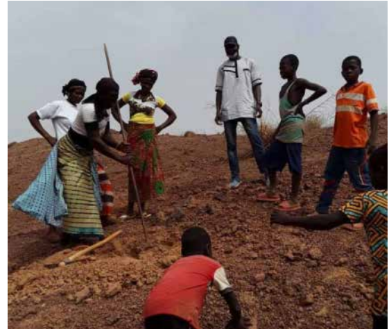
Photo 5a et b Extraction, division, collecte et transports de moellons pour les cordons pierreux

Nous avons fait le placement à la main au fur et à mesure. Nous avons réalisé souvent le cordon avec une couche de moellon par ligne et sur certaines lignes nous avons augmenté le nombre de couches de moellons. Il y a même des lignes où nous avons réalisés toute une construction sur 0,5 mètre de largeur. Les plus petits moellons étaient rassemblés pour construire un ralentisseur de taille importante au niveau des zones de forte pente. Tout se fait en fonction de la vitesse de l'eau.