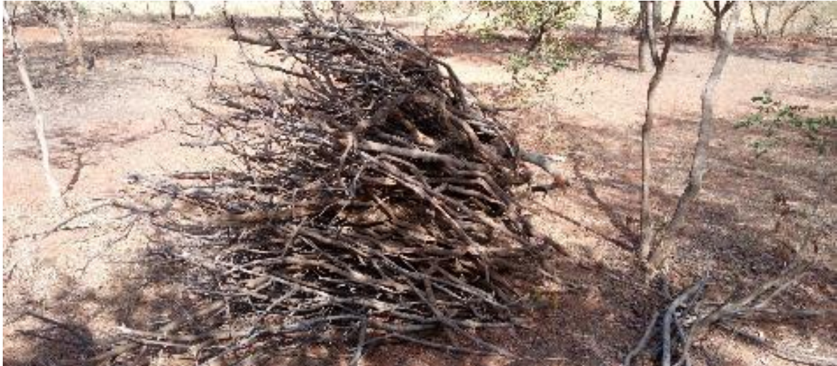
Photo 20 Bois mort rassemblé dans la forêt de Bangre Raaga par des femmes