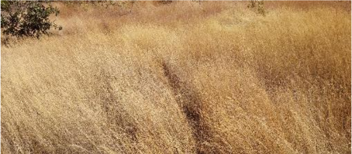
Photo 25 Zone de reproduction des perdrix à Bangre Raaga