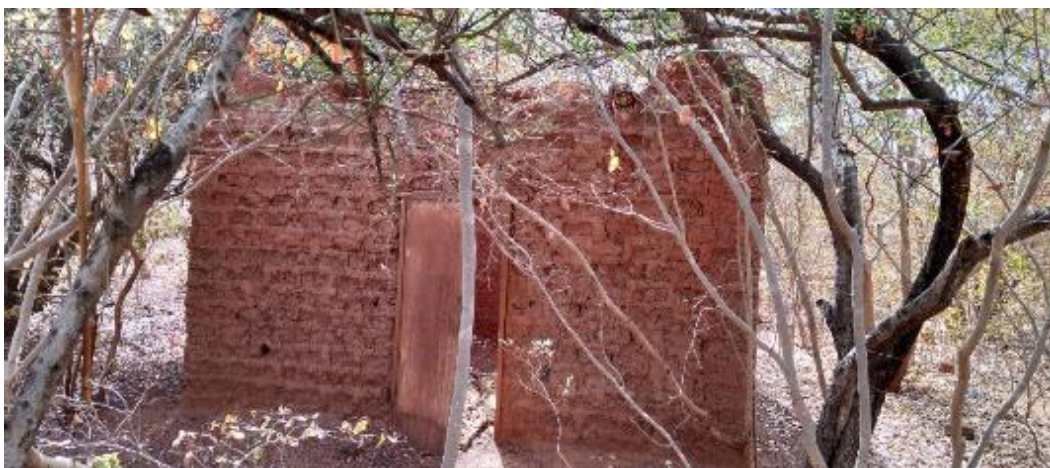
Photo 21 La toute première maison construite pour pouvoir habiter sur place et garder les lieux (Mise en défens) 15

Nous avons aussi bénéficié de panneaux solaires de Neertamba pour des lampadaires devant les portails.