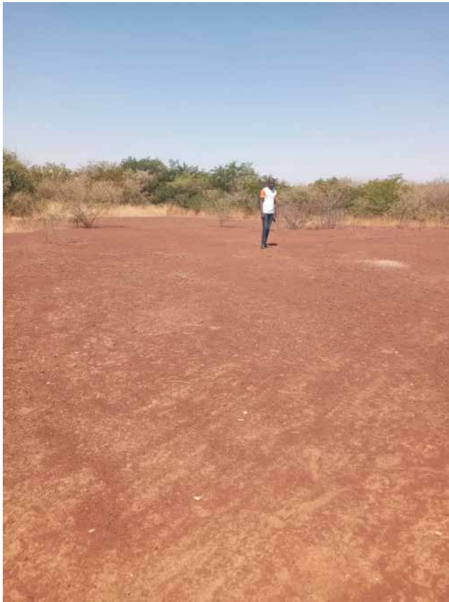
Photo 11 Zipelle témoin

Les arbres étaient faibles ; ils souffraient du manque d'eau et étaient traumatisés par les vents. Il n'y avait pas assez d'arbres et le peu qui était présent subissait la pression des hommes et des animaux.