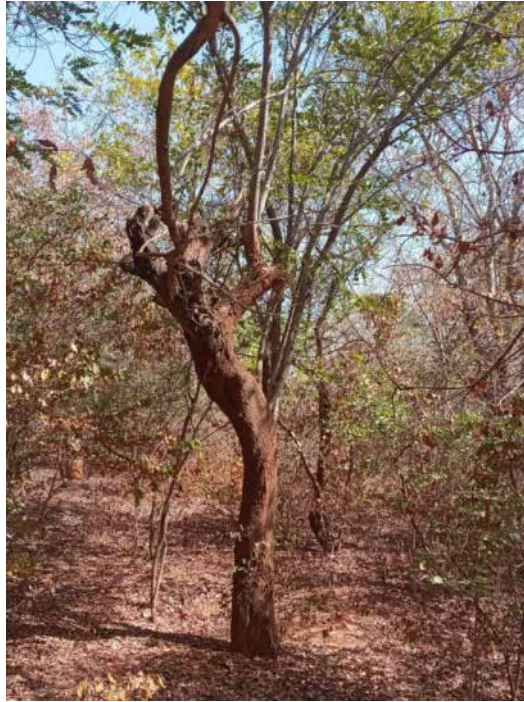
Photo 27 Premier arbre semé par Yakouba SAVADOGO (âge plus de 50ans)