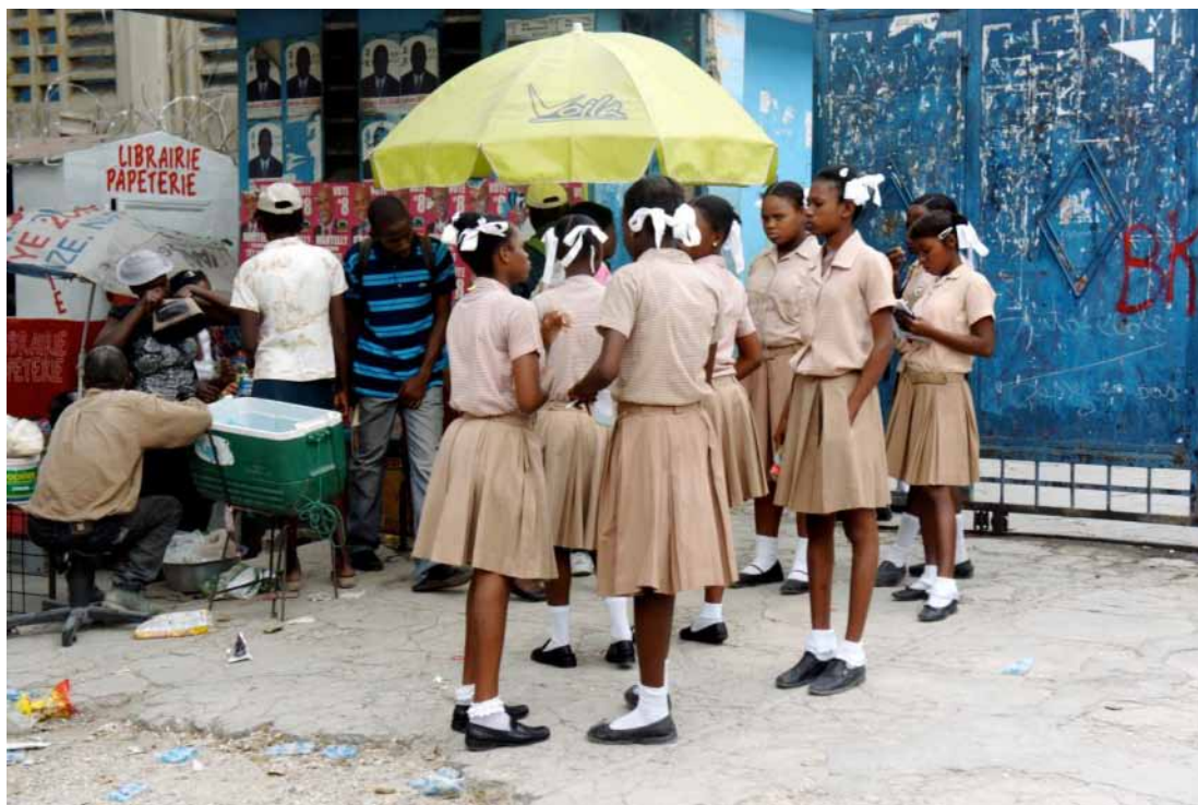
Les écolières, Port-au-Prince 2012 © IRD / Claire Zanuso - Réf. Photothèque Indigo : 54589

logements. Malgré l'intervention immédiate de la communauté internationale à travers l'envoi d'équipes de secours, des promesses d'aides financières et de soutien au processus de reconstruction et de développement, la situation tarde à se normaliser.