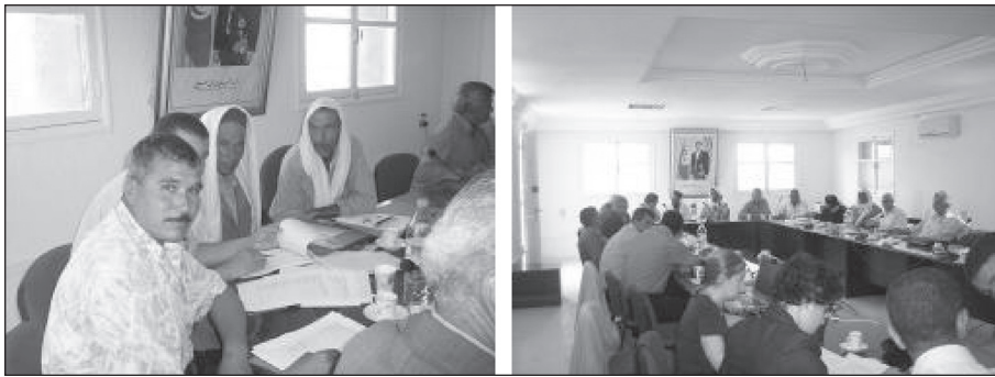
Figure 3. Les agriculteurs pendant le jeu de simulation.