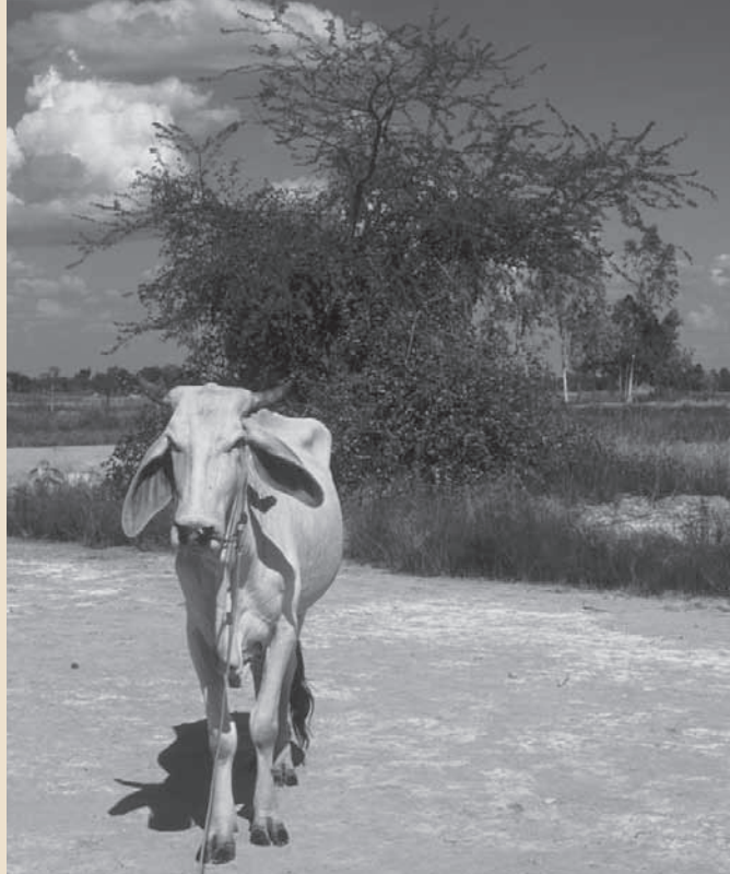
Riziculture et pastoralisme sur des terres soumises à des remontées salines souterraines conséquence d'une déforestation intense et récente (région de Khon Kaen, Nord-est de la Thaïlande)