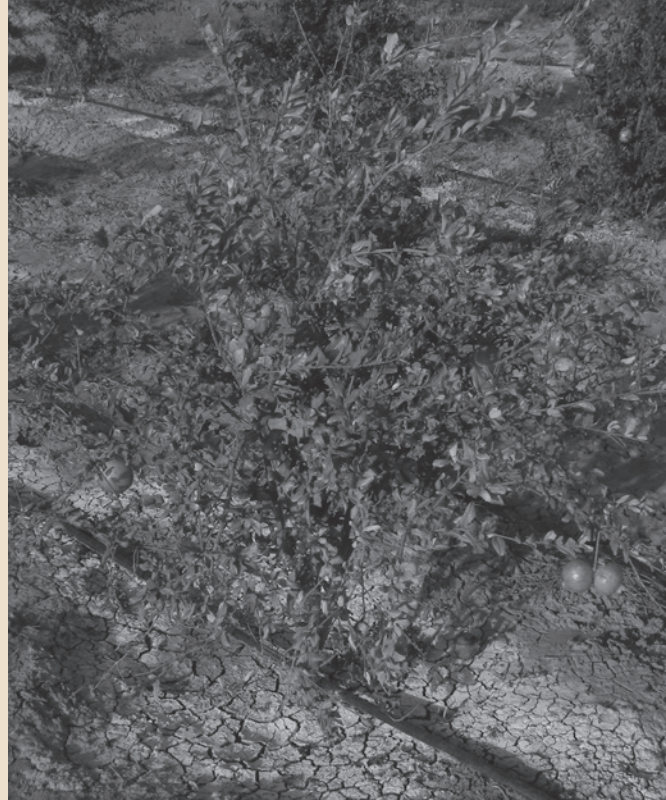
Arboriculture (grenadier) et irrigation par goutte à goutte sur des terres argileuses et salées (région de Kairouan, Tunisie centrale)