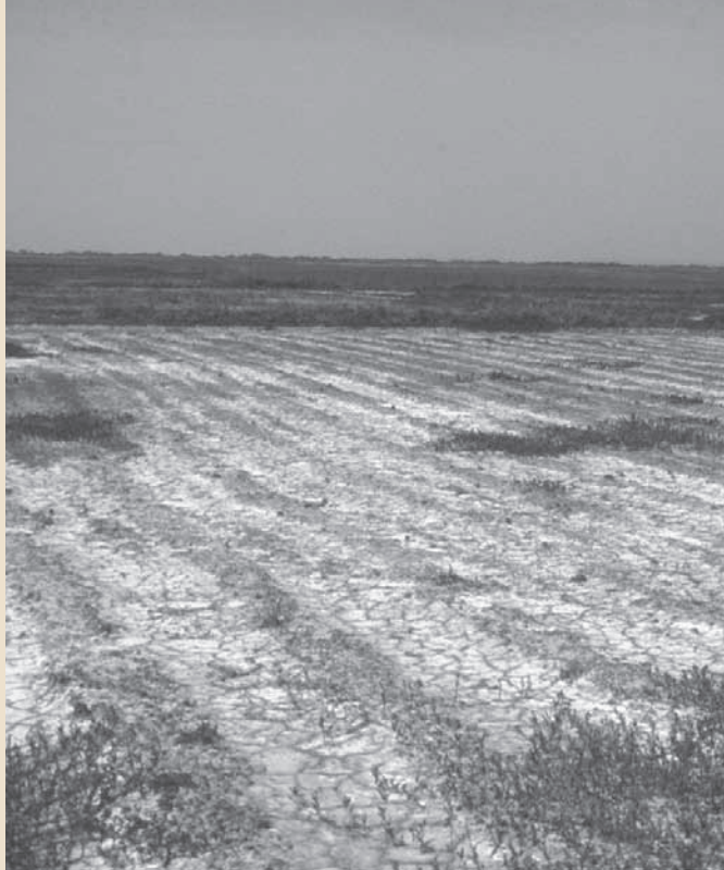
Rizières abandonnées par une salinisation liée à une sécheresse climatique durable (région de Ziguinchor, Casamance, Sénégal)