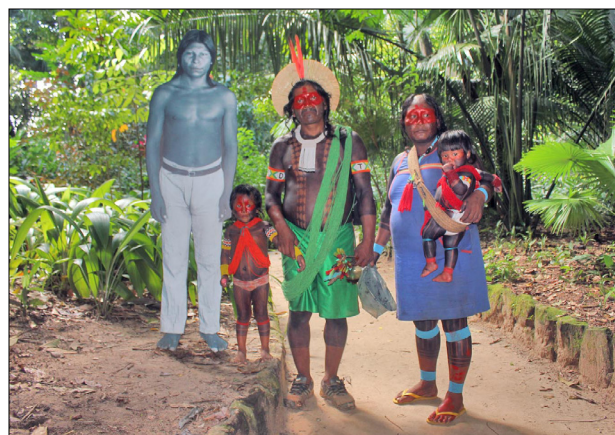
Figura 1. Casal Mebêngôkre-Kayapó no Parque Zoológico do Museu Paraense Emílio Goeldi, Belém, ao lado de uma fotografia em tamanho real de um Irã Amranh que visitou o Museu com Frei Gil, em 1902.

Em 2009-2010, o MPEG e o IRD organizaram uma série de exposições no Brasil e na França, contando com a participação de pesquisadores indígenas e de acadêmicos de ambos os países, incluindo a exposição "Mebêngôkre nhô pyka – Nossa terra Mebêngôkre", realizada em Belém e depois em outras localidades, de forma itinerante (2009-2011); a exposição permanente "Forêt Tropicale",