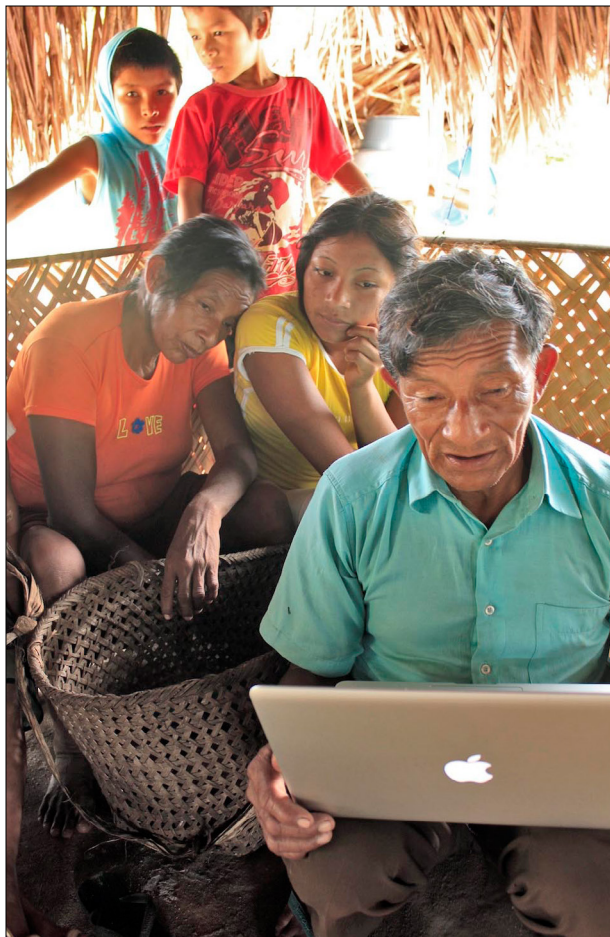
Figura 6. Repatriação digital do acervo Baniwa no rio Ayari, alto rio Negro. (2012).

Durante uma viagem de campo ao rio Negro, em 2012, após o trabalho no acervo do MPEG, foi realizada uma atividade de 'repatriação digital' preliminar (Figura 6), deixando um registro fotográfico digital completo do acervo Koch-Grünberg no Museu, coletado entre os Baniwa em cada comunidade visitada, sendo esta atividade geralmente encarregada ao professor da escola indígena (Shepard Jr., 2012). Em cada comunidade, nos reunimos com as lideranças para mostrar as peças do acervo Baniwa e fazer entrevistas sobre o nome, o uso e a fabricação delas. Foi reforçada a observação de que as mais importantes peças rituais tinham sido perdidas há muitas décadas. Alguns poucos ainda sabiam fabricar certas peças. Na comunidade