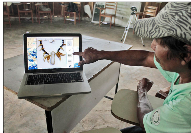
Figura 7. Os colares de cilindro de quartzo e de dentes de onça foram os objetos mais admirados durante o trabalho de repatriação digital.

O diálogo com os Baniwa provocou questionamentos quanto à prática de museologia e uma série de reflexões sobre as rupturas, além das continuidades, com o passado. O intuito do nosso diálogo é o de incentivar um tipo de repatriação que seria mais 'virtual' do que 'física', tomando em conta a fragilidade das peças, incentivando, assim, a produção de novas peças baseadas nos objetos guardados em acervo. Considerando-se o sentimento