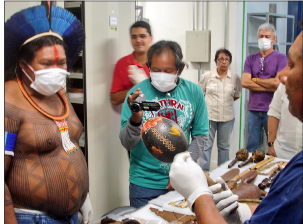
Figura 2. Máscaras e luvas protegem tanto os objetos de manuseio, quanto as pessoas dos espíritos mekaron.