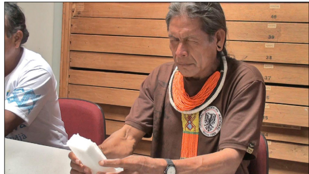
Figura 3. Kaikware entra em transe para pedir permissão ao espírito do dono de uma peça antiga, para tocá-la. Imagem de vídeo 3 : Glenn H. Shepard Jr. (2012).

Com o desenvolver do trabalho no acervo, os interlocutores Mebêngôkre-Kayapó foram ganhando confiança no manuseio das peças e nos cuidados, tanto físicos quanto espirituais, tomados para evitar perigos. Os interlocutores mostraram interesse em explicar a fabricação e o uso de cada objeto, enfatizando sua capacidade de fabricar quase todas as peças no momento atual. Mesmo assim, e em grande contraste com a experiência com os Baniwa (ver a seguir), os interlocutores Mebêngôkre-Kayapó, de modo geral, evidenciaram pouco fascínio