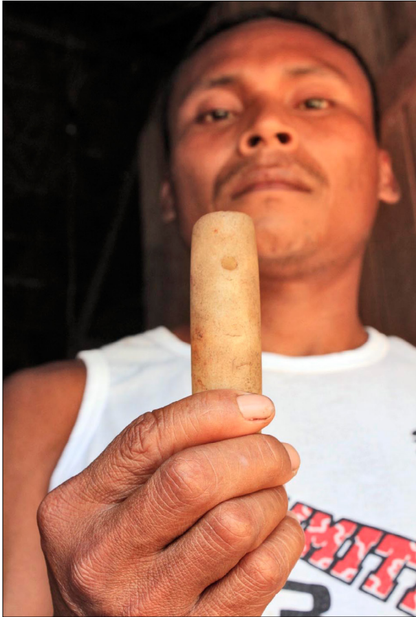
Figura 8. “Meu pai tinha um desses!”: Dzunui (cilindro de quartzo) encontrado em uma das comunidades Baniwa visitadas.

de pertencimento dos objetos implícito na atitude dos interlocutores e um expresso desconforto com o contexto colonial da aquisição deles, em especial peças consideradas sagradas, o acervo precisa se preparar para futuras demandas de acesso aos objetos e, talvez, solicitações de repatriação.