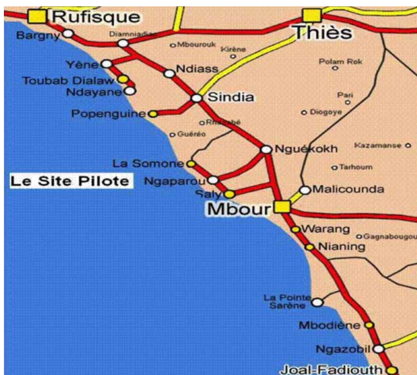
Figure 2 : Carte de la Petite Côte, Sénégal