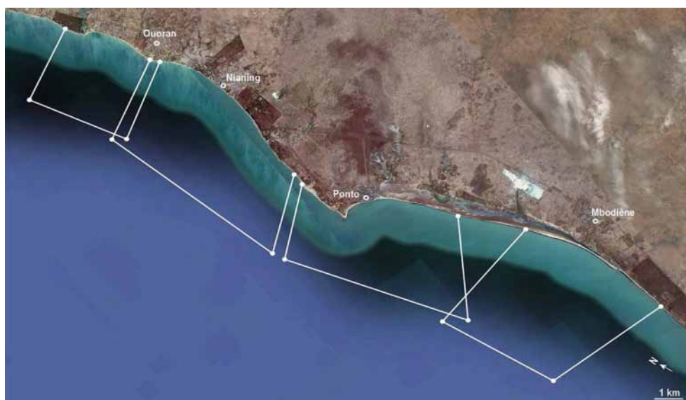
Figure 3 : Délimitation des ZPP, Petite Côte, Sénégal