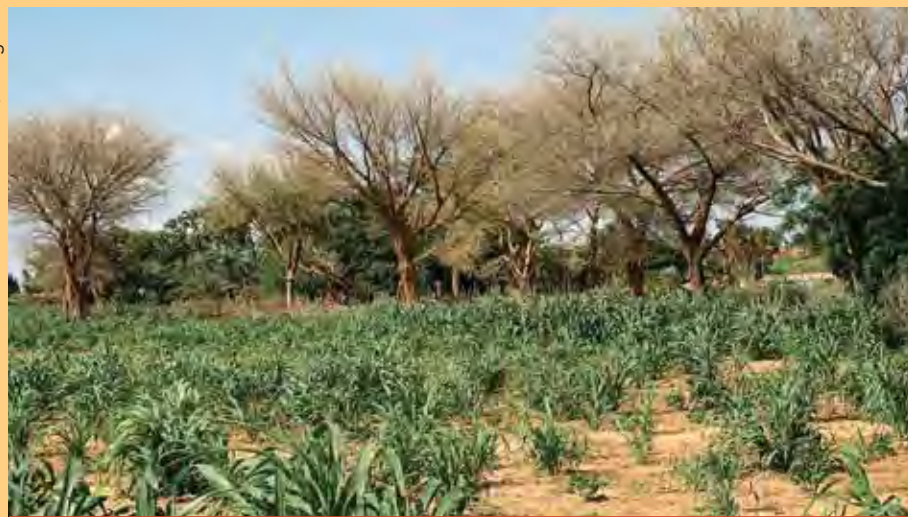
Champ de sorgho au Niger.