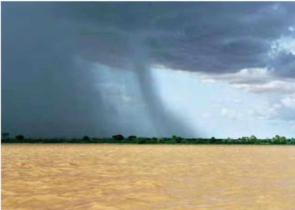
Arrivée de la pluie au Niger. Au Sahel, les orages sont plus violents depuis une vingtaine d'années.