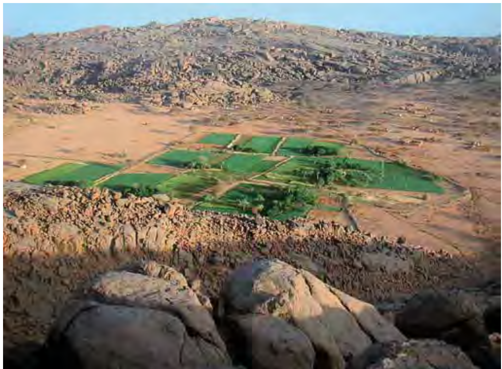
Village et jardins irrigués d'Akodédé, Niger.

Région semi-aride, le Sahel est particulièrement sensible à la variabilité des précipitations. Les périodes de très forte sécheresse qui ont sévi entre les années 1970 et 1980 ont eu des effets dévastateurs sur les écosystèmes, les populations et leurs ressources. La transformation massive de l'usage des sols, liée en particulier à la rapide croissance démographique, a aussi été par endroits le moteur de cette dégradation des terres.