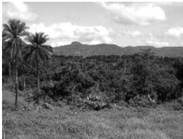
Figure 1. Vue des environs de Kindia.

Les localités d'étude sont situées dans un rayon de 20 km autour de Kindia. Il s'agit des villages de Kilissi (09°57'N, 12°51'W,