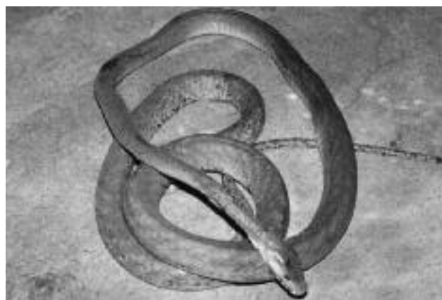
Figure 2. Le mamba noir Dendroaspis polylepis

La présence de huit spécimens du mamba noir D. polylepis est inattendue et particulièrement remarquable car il s'agit d'une espèce rarement collectée en Afrique de l'Ouest où son statut est encore incertain (9) (Fig. 2). Découverte pour la première fois par Villiers (10) dans les environs de Dakar, sa présence en Afrique de l'Ouest n'a été définitivement admise que tardivement (11, 12), une introduction accidentelle en provenance d'Afrique du Sud à partir du port de Dakar ayant longtemps été évoquée pour expliquer sa présence au Sénégal. En Guinée, un spécimen que nous avons collecté en 1996 à Téliélé est conservé à la zoothèque de l'Institut Pasteur de Guinée (13). Récemment, deux autres spécimens provenant du Parc National du Haut-Niger près de Kouroussa en Guinée ont été