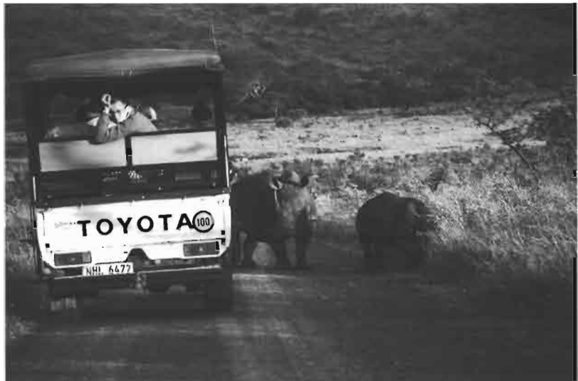
La réserve naturelle d'Hluhluwe-Umfolozi, créée en 1895 en Afrique du Sud, est une des plus anciennes aires protégées au monde. Connue pour sa gestion des rhinocéros blancs, elle représente l'archétype de la commercialisation de la conservation, proposant un tourisme de luxe et des ventes de rhinocéros dans toute l'Afrique australe (E. Rodary).

Au niveau régional, de nouvelles approches se sont diffusées dans la décennie de 1990. L'approche « écosystémique » en particulier, initiée en 1995 par la Convention sur la diversité biologique, vise à associer, à l'échelle régionale, des aires protégées et des territoires anthropisés (agricoles, etc.) dans un même schéma d'aménagement. L'organisation d'aires protégées non plus envisagées comme unités isolées mais comme éléments d'infrastructures naturelles a tendance à devenir un volet systématique des politiques de gestion de la biodiversité, comme c'est le cas à l'échelle européenne (Bonnin et al., 2007). C'est dans ce cadre régional que se développent également les « aires protégées transfrontalières », à travers lesquelles on cherche à coordonner des espaces naturels que les frontières internationales divisaient arbitrairement, comme dans le cas de la coopération jordanaisraélienne autour du « parc pour la paix » du golfe d'Aqaba (et la mer Rouge). Enfin, le réchauffement climatique d'origine anthropique induit lui aussi des reconfigurations dans la gestion des aires protégées.