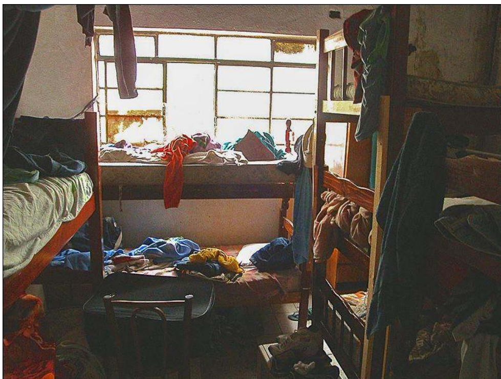
Illustration 7 - Dortoir d'ouvriers, séparé de l'atelier par une cloison, quartier du Bom Retiro, São Paulo