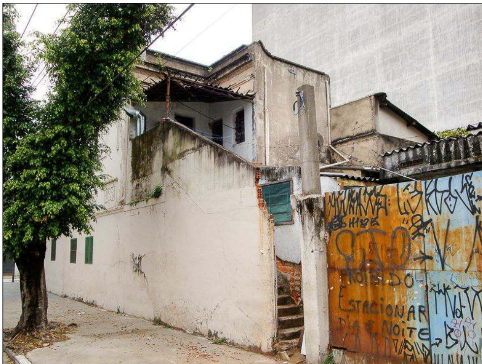
Illustration 5 - Maison abritant un atelier de confection où travaillent et vivent une dizaine d'immigrés Paraguayens, rua dos Italianos, quartier du Bom Retiro à São Paulo