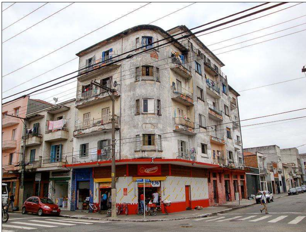
Illustration 4 - Bâtiment résidentiel où sont installés plusieurs ateliers de confection, Rua Hipódromo et Rua 25 de Abril, quartier du Brás, São Paulo