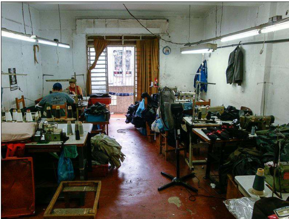
Illustration 1 - Vue générale d'un atelier du centre-ville de São Paulo, Bom Retiro