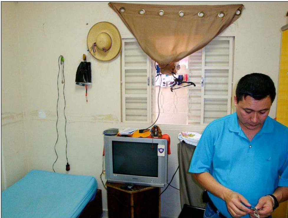
Illustration 6 - Chambre double, dans un appartement collectif hébergeant des ouvriers situé à quelques rues de l'atelier qui les emploie, quartier du Bom Retiro à São Paulo