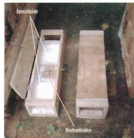
Figure 1 : Boîte de Kartman

Tout au long de l'étude, les appâts et la poudre insecticide ont été remplacés quotidiennement.