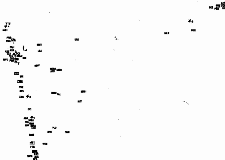
FIG. 2. — Analyse factorielle : distribution des biotopes et des espèces selon le plan formé par les axes 1 et 2 (Les nématodes sont apollonnés).

Ce groupe est caractérisé par un grand nombre d'espèces dont certaines sont typiques du mull ( Kalaphorura burmeisteri (KBU), Pseudosinella declapiens (PDE), Xenylla grisea (XGR), Pseudosinella alba (PAL), Mesaphorura italica (MIT) ou préférentielles de ce type d'humus ( Dicyrtomina minuta (DMI), Heteromurus major (HMA), Lepidocyrtus curvicolis (LCU)). Dicyrtoma fusca (DFU) et Orchesella villosa (OVI) sont des hygrophiles préférentielles, fréquentes en surface sur les sols frais (argileux). Aucune espèce acidophile n'est associée à ce groupe.