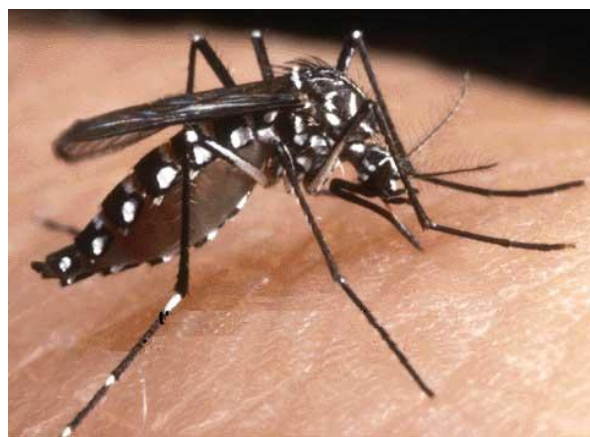
Photos 1. Aedes albopictus en action. Il est facilement reconnaissable à son corps noir rayé de blanc.

articulations après une phase de fièvre et de courbatures et d'éruptions cutanées, s'ajoute l'inquiétude d'éventuelles séquelles notamment pour les plus jeunes et dans les cas les plus extrêmes de la mort directe ou indirecte causée par le virus. Le vecteur de transmission du virus à l'homme est le moustique de la famille Aedes et notamment Aedes aegypti , Aedes africanus et dans le cas de La Réunion Aedes albopictus . Ce moustique est aussi porteur de la dengue, autre maladie virale présente à La Réunion 3 .