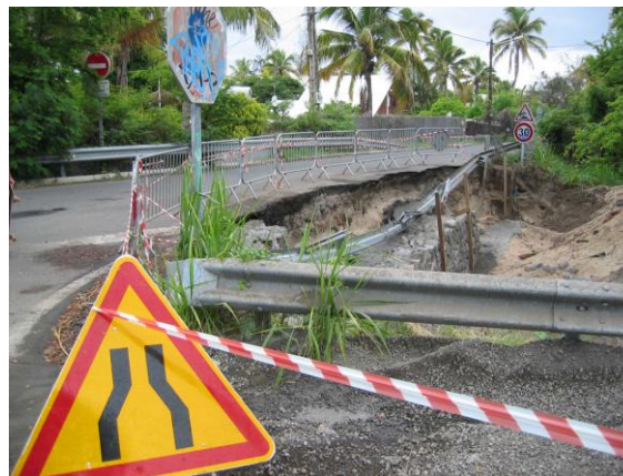
Photo 3. Exemple des dégâts occasionnés à La Réunion (Grand Fond) lors de la tempête tropicale précédente du 18 au 23 février 2006