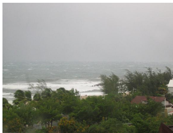
Photo 2. La tempête tropicale Diwa le 05 mars 2006, vue sur Boucan Canot

Diwa, tempête tropicale qui a sévi sur La Réunion du 05 au 07 mars 2006, a été remarquable pour l'intensité des pluies. Météo France, dans son bilan 25 sur Diwa, précise que les valeurs maximales de pluviométrie se rapprochent de celles du record mondial de précipitations en 3 jours établi en janvier 1980 à Grand-Ilet, île de