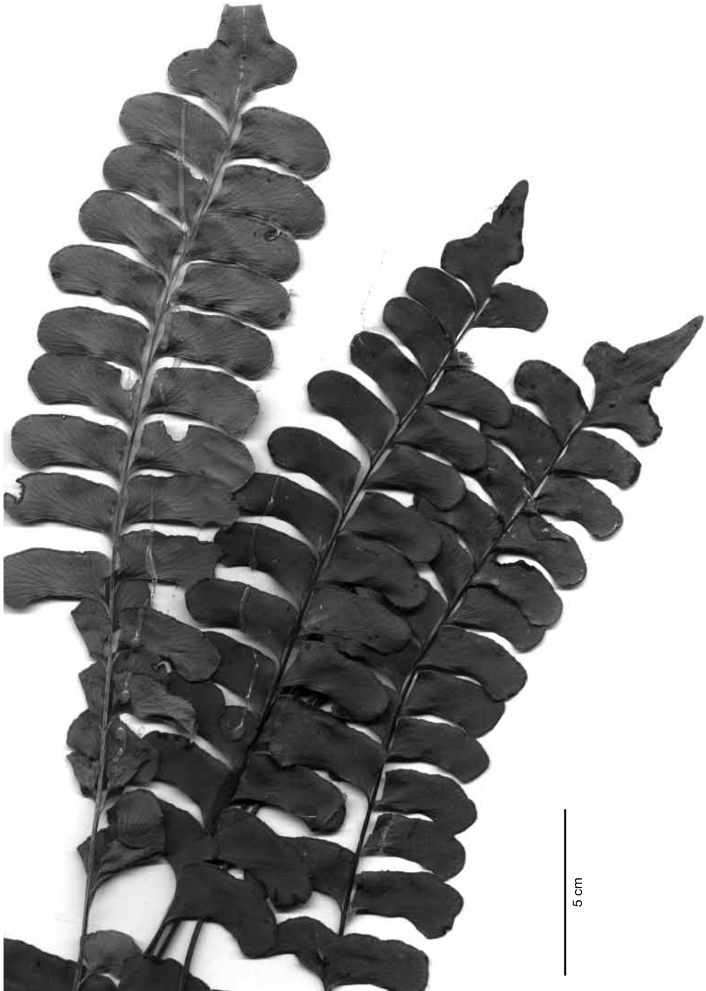
FIG. 2. — Lindsaea lancea var. submontana Boudrie & Cremers, Monts Bakra, Guyane française, Granville 14959, CAY.