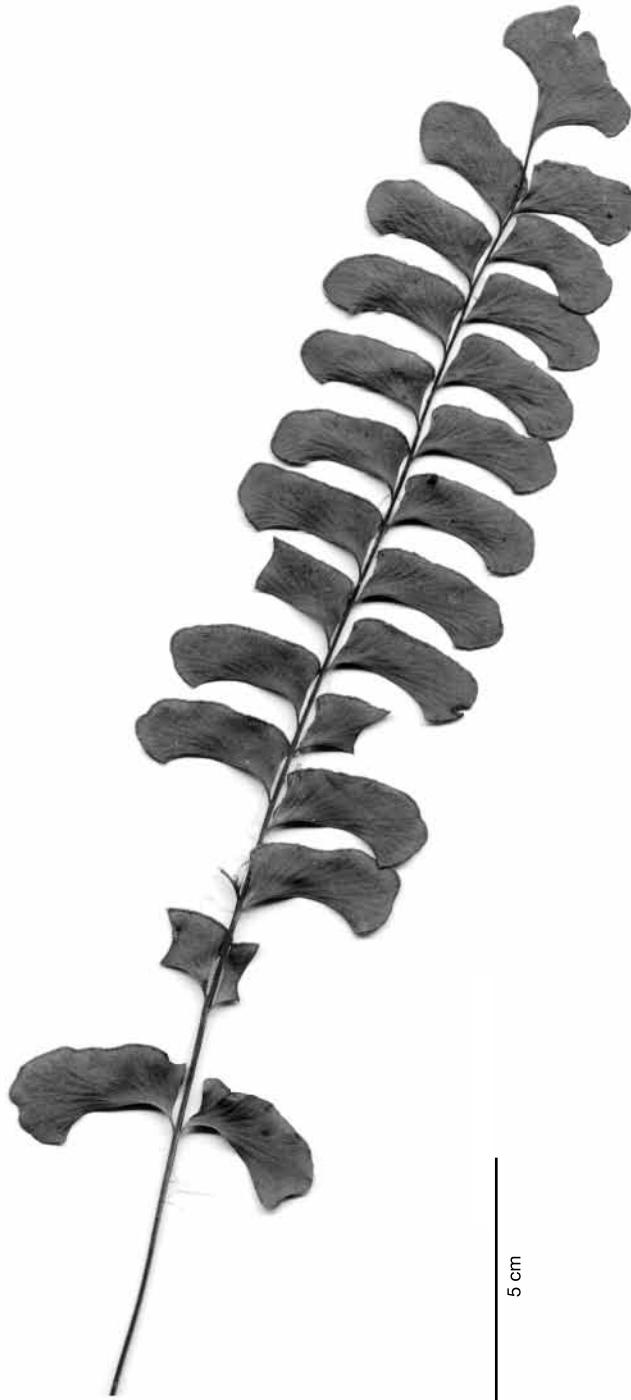
FIG. 1. — Lindsaea lancea var. submontana Boudrie & Cremers, Montagne de la Trinité, Guyane française, Granville 13665 , isotype CAY.