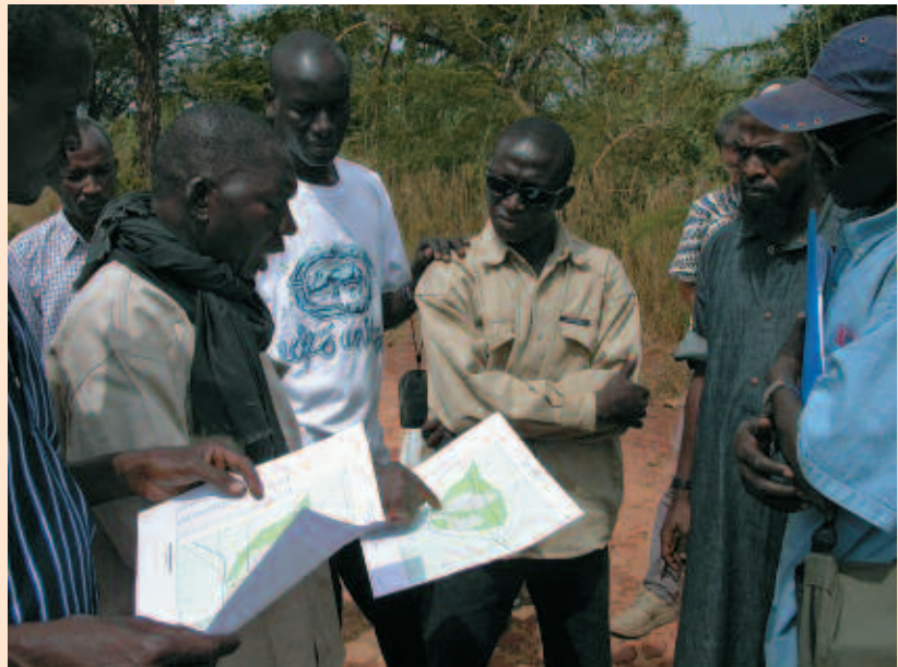
Présentation par le bureau d'études Agefore aux participants de l'école-chercheurs Savafor d'un inventaire forestier réalisé près de Siby (Mali).

Dans un effort de synthèse pour capitaliser les résultats de la recherche sur la productivité des savanes à l'échelle régionale, une école-chercheurs, baptisée Savafor, s'est rassemblée à Bamako au Mali, du 19 au 27 octobre 2005. Elle a réuni plus de 20 participants de la sous-région autour de communications orales, de débats (entre chercheurs et avec les acteurs du développement), de travaux communs sur des jeux de données et de sorties sur le terrain. Cette école-chercheurs avait deux objectifs : ▪ Faire le point sur les méthodes pour estimer la biomasse et la productivité des formations savaniques, en confrontant les expériences respectives de chercheurs de différents pays de l'Afrique de l'Ouest et centrale. ▪ Favoriser une synergie, à l'échelle régionale, entre les chercheurs travaillant sur le sujet. Le présent article vise à rendre compte des principales conclusions obtenues lors de cette école-chercheurs.