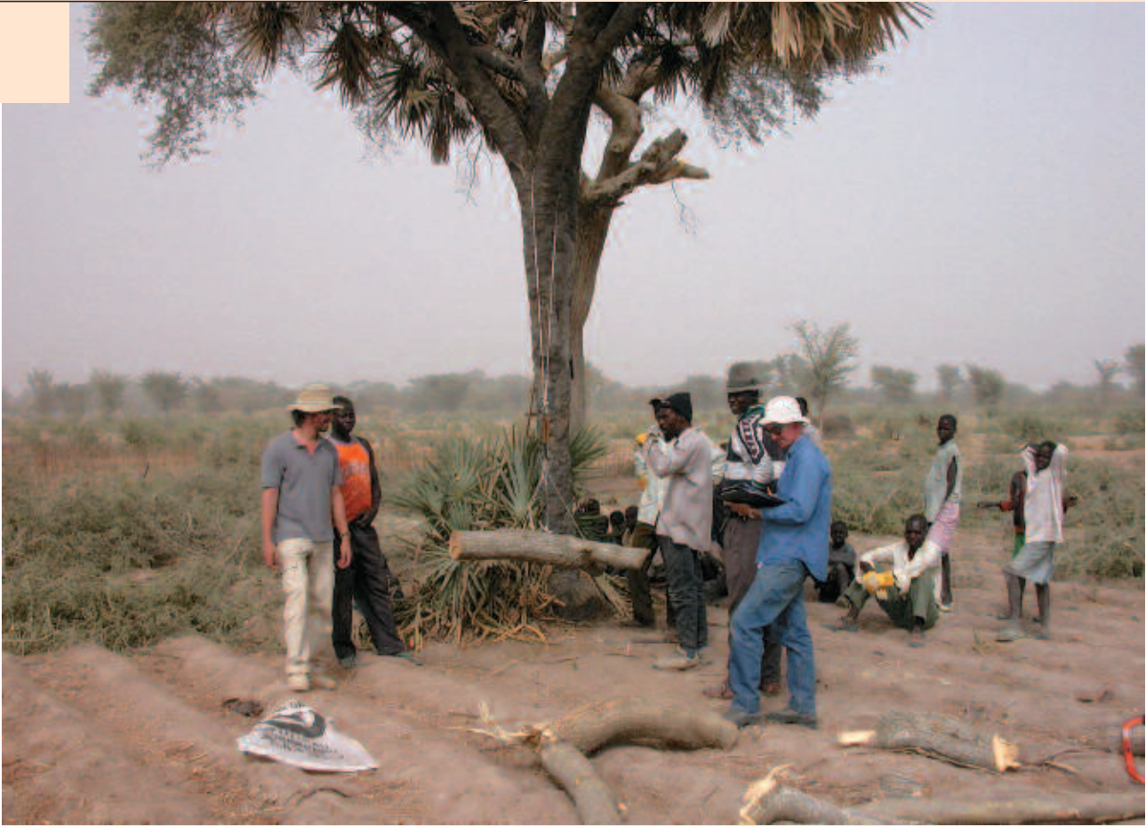
Élaboration de relations allométriques pour Faidherbia albida dans le Nord-Cameroun.