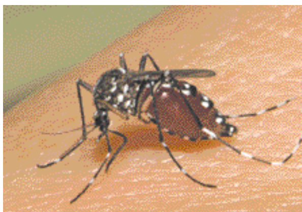
Figure 2 - Aedes albopictus en train de se gorger

Ae. albopictus est souvent considéré comme un vecteur secondaire (9). Bien qu'il ne soit pas reconnu comme le vecteur majeur des virus de la dengue, des observations en conditions de laboratoire et naturelles ont montré qu' Ae. albopictus pouvait