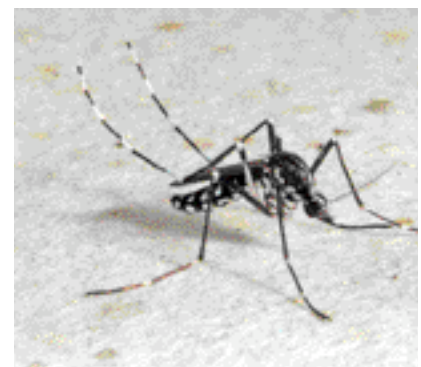
Figure 1 - Aedes albopictus © A.B. Failloux-Manuellan/Service photo/Institut Pasteur.

Les femelles d' Ae. albopictus déposent leurs œufs au sein de petites collections d'eau naturelle (creux de rochers, trous d'arbres, plantes engainantes, broméliacées, bambous...) ou artificielle (réservoirs d'eau,