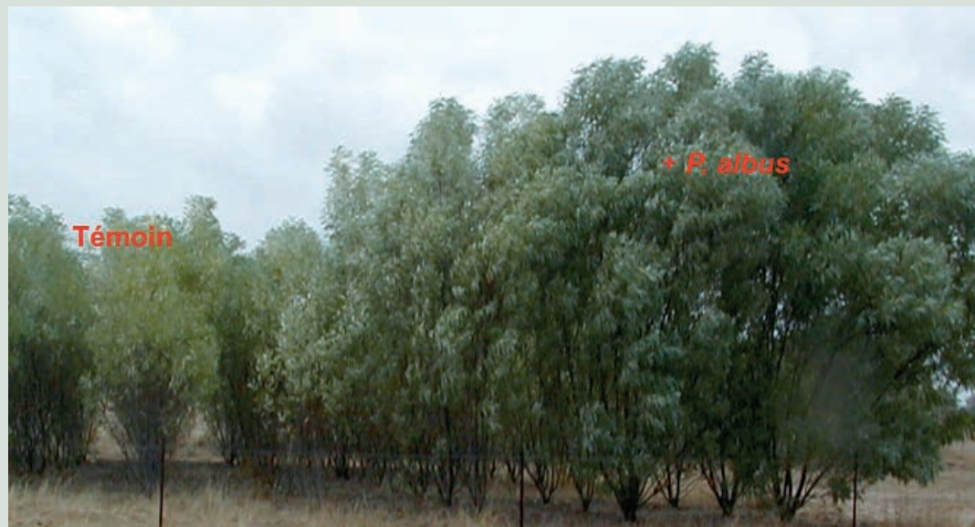
Photo 1. Effet de l'inoculation ectomycorhizienne sur la croissance de Acacia holosericea après deux années de plantation au Sénégal.

3 Université Lyon 1 Cnrs, Umr 5558 Laboratoire de biométrie et biologie évolutive 69622 Villeurbanne Cedex France