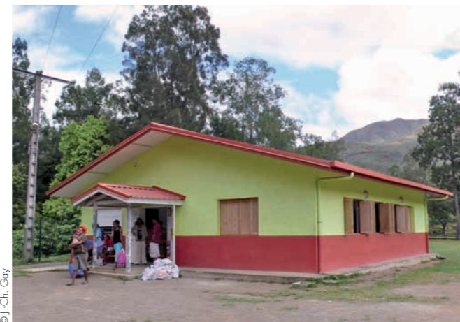
Maison de quartier de Val-Suzon (Dumbéa)

l'agglomération. Une première étape passe par l'émergence à l'échelle communale d'une centralité, mais c'est un vrai défi, en dépit d'une action volontariste qu'on remarque au Mont-Dore, avec un noyau se structurant autour de la mairie et de la poste. Pour le sud de cette commune, le centre commercial de La Coulée constitue un lieu important avec galerie commerciale et supermarché, dernière halte vers le Grand Sud, ses pique-niques et ses bivouacs, tout comme la station-service de Plum où l'on vient faire le plein des bateaux avant de partir sur le lagon. Ce rôle de porte de l'agglomération se retrouve au nord avec le péage de Koutio, lieu de rendez-vous pour ceux qui partent en Brousse ou ceux qui en