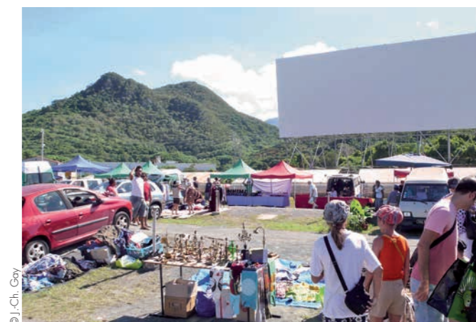
Marché aux puces du Pont-des-Français (Mont-Dore)

En fin de semaine, l'animation est polarisée par les quartiers sud. L'île aux Canards est régulièrement louée pour l'orga-