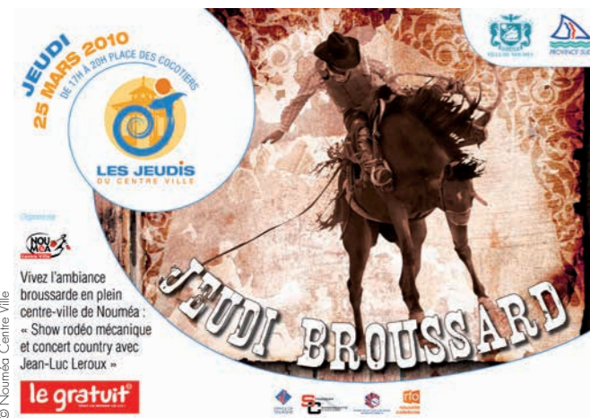
Affiche d'un Jeudi du centre-ville

Devant le dynamisme des quartiers de la Baie-des-Citrons et de l'Anse-Vata, le centre-ville fait pâle figure malgré des opérations tentant de le redynamiser, comme, sur la place des Cocotiers,