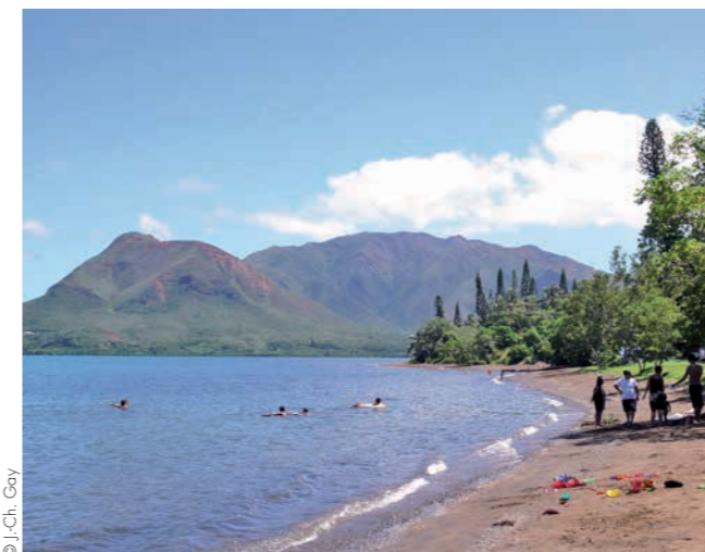
Plage Carcassonne au Mont-Dore

Des milliers de personnes, de communautés différentes, fréquentent les plages chaque fin de semaine, spécialement en saison chaude. Celle de la baie des Citrons est probablement la plus à la mode. S'y côtoient ou s'y succèdent toutes les composantes de la population. Les personnes âgées s'y rendent tôt et tous les jours, tout comme certains sportifs, n'hésitant pas à pratiquer leur activité physique (jogging,