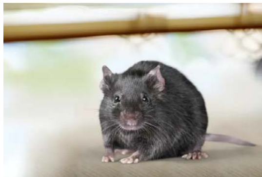
À Madagascar, certains rats noirs transportent des bacilles de la peste multirésistants aux antibiotiques. Shutterstock

Encore plus inquiétant : des souches de bacille de la peste résistantes à plusieurs groupes d'antibiotiques utilisés pour traiter les malades pesteux ont été récemment isolées chez des rats malgaches. Qu'advierait-il si ces souches mortelles et mutantes se mettaient à circuler massivement chez les rongeurs des villages ou des bas quartiers des villes de Madagascar où la peste sévit chaque année ? Qu'en serait-il si des rats porteurs de bacilles multirésistants aux antibiotiques voyageaient de port en port avec les navires marchands – comme cela a déjà été le cas lors de la troisième pandémie de peste à la fin du XIX e et au début du XX e siècle ?