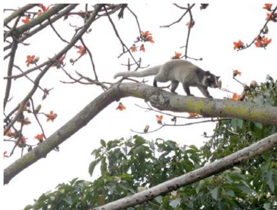
La civette palmiste, réservoir du coronavirus SARS-CoV-1, à l'origine de l'épidémie de SRAS de 2002-2003.

Citoyens, acteurs politiques ou socio-économiques, tous doivent comprendre et accepter que ces recherches certes coûteuses sont le prix à payer pour nous préparer au mieux à faire face rapidement aux prochaines épidémies d'origine animale qui ne manqueront pas de subvenir. Quelle qu'en soit la provenance.