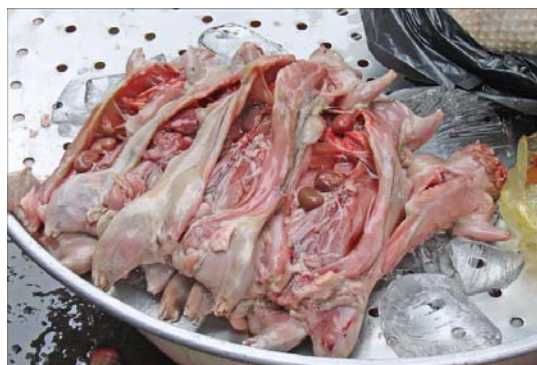
Les rongeurs sont consommés dans de nombreux endroits de la planète (comme cette viande vendue sur le marché de Sa Dec, au Vietnam, provenant probablement de rats des rizières).

Toutes ces situations aboutissent à des contacts innombrables entre humains et rongeurs. Les chaînes de transmission courtes mais répétées nécessaires à l'adaptation d'un pathogène de rongeur à l'être humain sont donc probablement à l'œuvre un nombre incalculable de fois par jour à travers le monde. Sur la base des connaissances actuelles, l'Organisation Mondiale de la Santé (OMS) estime que 400 millions de personnes sont infectées chaque année par un pathogène dont l'écologie peut impliquer les rongeurs.