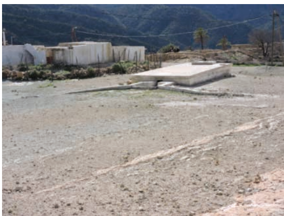
Matfia à usages communautaires (eau domestique) à Takoucht, Haut Atlas occidental