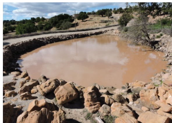
Iferd à usage communautaire (eau domestique) à Takoucht, Haut Atlas occidental.