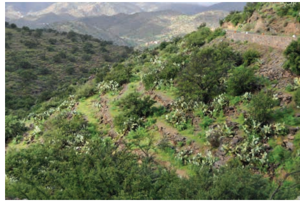
Terrasses et extension du cactus dans le versant occidental de l'Anti Atlas.