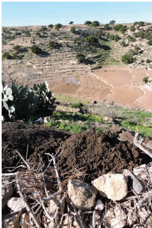
Figure 4. Fabrication et épandage du fumier sur les parcelles cultivées, Commune Amskroud, Haut Atlas Occidental