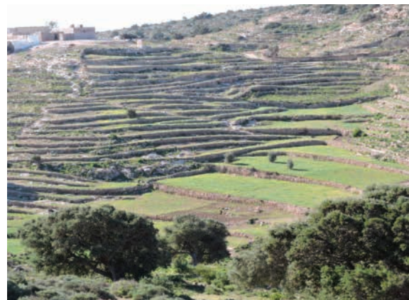
Figure 3. Divers aménagements de versants en milieux semi-arides à arides