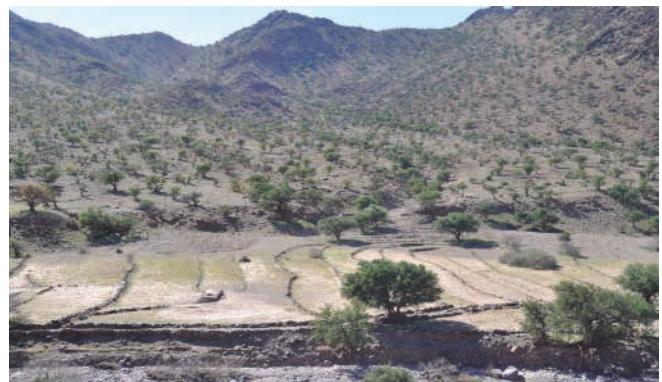
Agriculture de ruissellement : Épandage des eaux de crue (Fayd), Commune Al Fayd, Aoulouz.