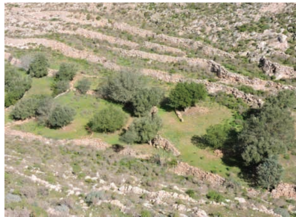
Terrasses et agroforesterie dans le Haut Atlas Occidental, Commune de Tamri.