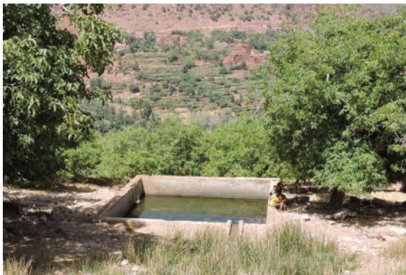
Tamda, bassin de stockage d'eau de la source à Tazlyida, Haut Atlas de Marrakech.

Les banquettes sont des cuvettes longues confectionnées parallèlement aux courbes de niveau. Elles sont constituées d'un talus, d'un fond et d'un bourrelet. Selon l'importance de chacun de ces trois éléments, la banquette prend soit un profil à fond plat permettant une meilleure mise en valeur du replat avec un bourrelet saillant et profilé. Ce profil favorise l'infiltration et améliore les réserves d'eau dans le sol. Une faible contre-pente du replat vers le talus améliore le régime hydrique dans la banquette. Soit elle prend un profil amorti dont le bourrelet moins profilé très peu turgescent, ce type de profil rappelle la terrasse et est recommandé sur les pentes faibles. Généralement, les banquettes sont confectionnées pour recevoir des plantations au milieu des replats qui favorisent leur stabilité et profitent des eaux de ruissellement retenues. Les banquettes sont des structures qui permettent d'améliorer l'infiltration de l'eau. De ce fait, elles ne doivent en aucun cas être réalisées sur des matériaux de mauvaise perméabilité, gonflants ou sensible au mouvement de masse (solifluxion). De même, pour avoir une banquette avec un dimensionnement optimal, il est souhaitable que le sol soit relativement profond (> 50cm). Les banquettes peuvent être confectionnées sur des pentes variables atteignant même 30 %. Mais, les meilleurs résultats sont obtenus sur des pentes faibles (15 %) car elles permettent d'avoir des replats plus larges.