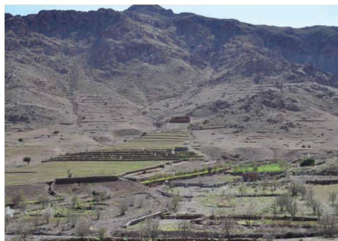
Figure 5. Intégration d'aménagements traditionnels et modernes de la vallée jusqu'au versant (Oued Aoulouz) pour une meilleure production en céréales (grains, paille), en légumes et en fruits (olives, amandes)

La majorité des techniques de gestion des terres en montagne semi-aride vise d'abord la gestion de l'eau, sa capture, son stockage et sa valorisation. Le ruissellement apporte aussi bien des appoints d'irrigation que des sédiments qui améliorent la fertilité du sol.