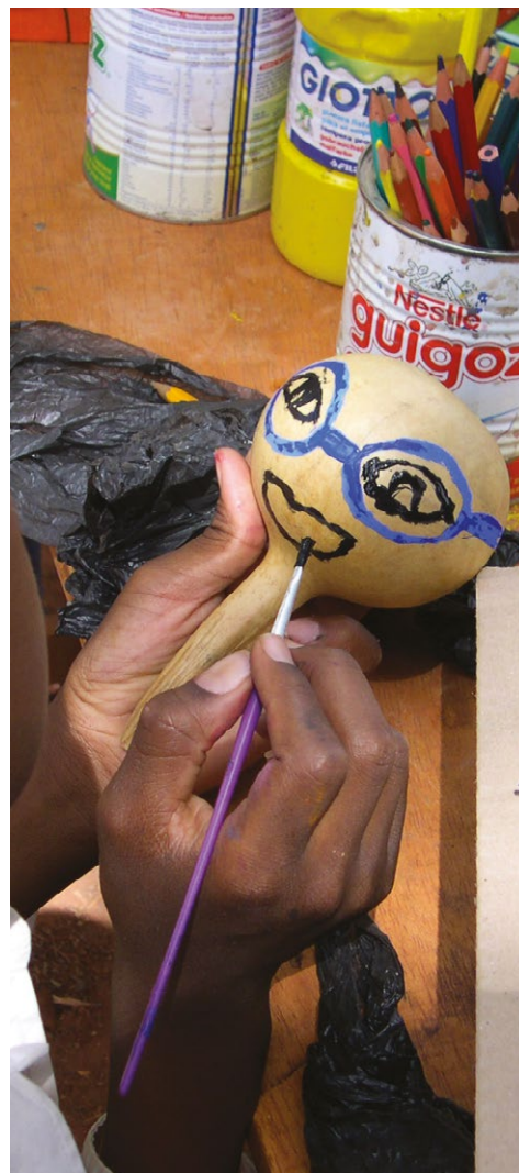
Photo 1 : Accompagnement Psycho-social des enfants au Burkina Faso. 2006.

à la lumière de travaux anthropologiques conduits au Burkina Faso, il s'agira de revenir sur les postures méthodologiques qui ont permis d'ériger une telle assertion.