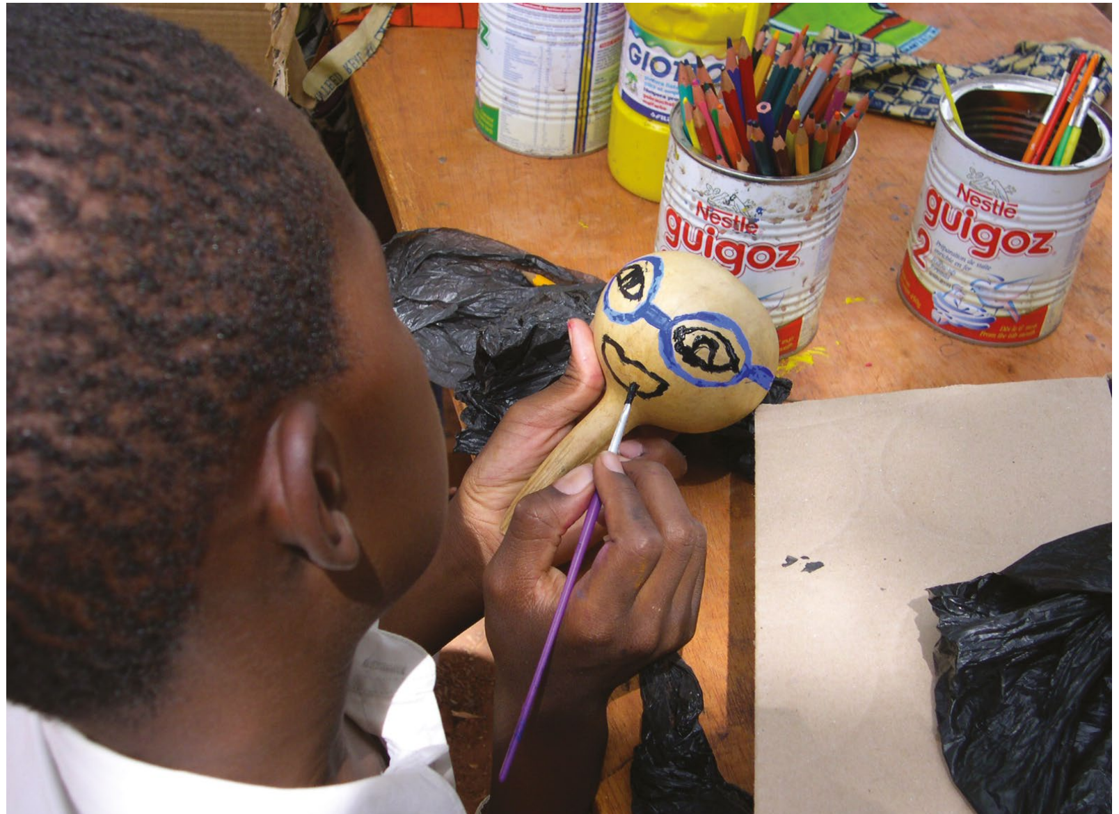
Photo 2 : Accompagnement Pyscho-social des enfants au Burkina Faso. L'annonce du VIH aux enfants est un défi de santé publique en Afrique. Il y a un grand dénuement en matière d'accompagnement psychologique des enfants, des parents et des soignants. 2006. (© IRD - Fabienne Heojaka - www.indigo.ird.fr).

François Delor et Michel Hubert (2003) ont proposé un cadre théorique de la vulnérabilité à l'aune de l'infection à VIH/sida. Selon ces auteurs, pour saisir le concept de vulnérabilité, il est nécessaire de prendre simultanément en compte trois niveaux : le contexte, les interactions sociales et la trajectoire individuelle. De fait, le contexte social influence les rencontres inter-individuelles qui sont composées de trajectoires variées. C'est en considérant ces niveaux qu'il est alors possible de saisir a) le risque pour un