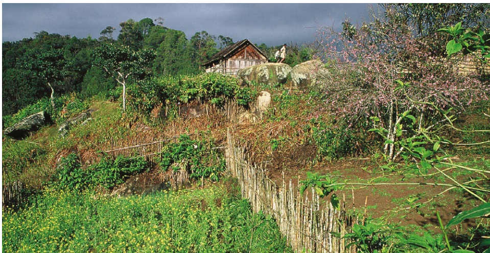
Photo 1 : Jardin agroforestier à Madagascar.

(Burnod et al., 2011). Ces ressources étaient utilisées par les populations pour produire des cultures pluviales, conduire leurs troupeaux ou prélever du bois. Les investisseurs étrangers bénéficient ainsi d'un accès privilégié à l'eau et au foncier en quelques mois et sans réelle contrainte (Burnod et al., 2011), tandis que les populations locales peinent à acquérir de la terre. L'état ne favorise pas les synergies possibles entre agro-industries et exploitations familiales. On note une perte d'intérêt pour l'agriculture familiale (Burnod et al., 2011) et sans doute une plus grande vulnérabilité du fait de facteurs exogènes imposés de façon brutale.