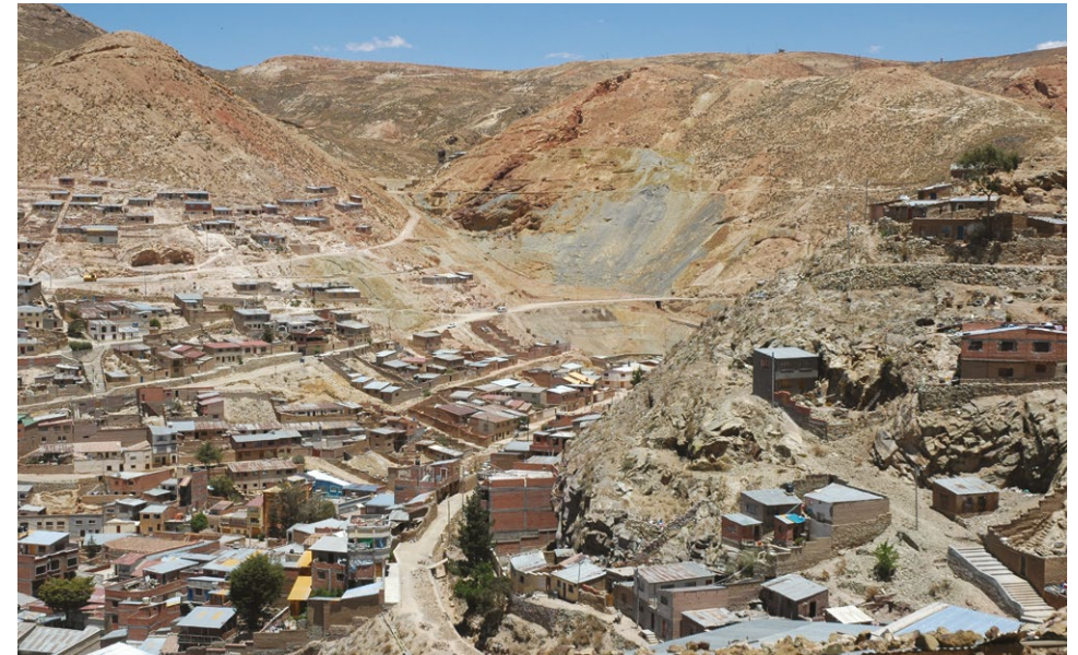
Photo 1 : Expansion urbaine sur les terrils des mines de Oruro, Bolivie, 2010 (© photo : H. Mazurek).

Comme tout concept pluriel, celui de vulnérabilité devient polysémique et donc imprécis pour la recherche. Selon la formulation de Lussault (« Nous sommes toujours-déjà vulnérables », Lussault, 2014), la vulnérabilité est avant tout l'expression d'une obsession du risque, d'une « culture tabloïd' de la peur », tout comme un outil d'appropriation par les pouvoirs publics qui peuvent alors désigner des coupables et des victimes. Ce terme a d'abord servi à identifier la pauvreté dans les années 70, puis s'est introduit dans le droit dans les années 80, etc., avec l'objectif chaque fois, de « domestiquer » les marges, les précaires ou de médiatiser la souffrance et l'impuissance des vulnérables (Thomas, 2010) ; l'esthétique du vulnérable devient l'oxymore de cette montée en puissance de la peur. La vulnérabilité permet ainsi un glissement sémantique d'un phénomène collectif et extérieur (l'exclusion qui est l'action d'exclure et suppose l'existence d'un groupe)