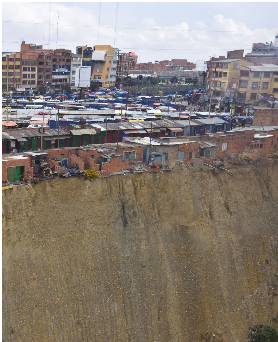
Photo 2 : Une vulnérabilité facilitée par les pouvoirs publics, El Alto, Bolivie, juillet 2019.

des impacts. La différence entre les deux donnera notre niveau de perception ou de connaissance en relation à l'action sur l'objet ou l'individu. Dans l'exemple du vase, le facteur de vulnérabilité structurelle supposée est la fragilité du verre. La vulnérabilité conjoncturelle dépendra de la nature et de l'intensité de l'action et du changement de contexte. Mais d'autres facteurs peuvent être inconnus, comme la hauteur du vase, qui le rend plus instable ; ou la présence d'un coussin qui amortira la chute. Ce n'est qu'en répétant l'expérience, et en accumulant les connaissances, que l'on pourra définir précisément les deux types de vulnérabilité, et évaluer la capacité de résilience en utilisant ces connaissances pour modifier les contextes et les paramètres de la vulnérabilité. Dans une grande mesure, les facteurs de vulnérabilité correspondent à un contexte déterminé et à un niveau d'information sur ses propres composantes et les composantes du contexte, lesquelles peuvent être individuelles ou collectives, matérielles ou immatérielles. La vulnérabilité n'est en tout cas pas deux choses : ce n'est pas la capacité de faire face (ceci est la résilience ou l'adaptation), ni celle de s'affronter aux risques car il peut très bien y avoir vulnérabilité sans risque. Être en situation de risque génère de la vulnérabilité (dans le sens de la vulnérabilité conjoncturelle), ce qui voudrait dire que risque et vulnérabilité sont intimement liés, voire parfois se confondent.