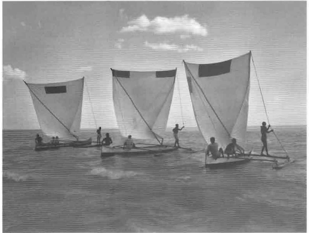
Chaque voile vezo porte une marque particulière.

étrangère, les sociétés nomades n'avaient pas en réalité la capacité d'organisation et la force guerrière pour conduire des expéditions d'envergure. Elles subirent plutôt la pression de populations maritimes qui cherchaient à les enrôler dans leurs flottes, armées pour la piraterie par de puissants pouvoirs politiques, comme les sultanats malais au XVI e siècle. La grande dispersion des nomades, leur préférence pour les petits archipels reculés et leurs pérégrinations le long de côtes souvent rendues inhospitalières par les vases et les dédales de racines aériennes des mangroves s'expliquent en partie par leur fuite de cette domination.