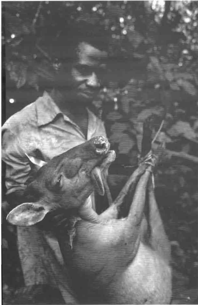
Retour de chasse chez les pygmées.

et des raquettes à neige, par exemple, confère aux Innu une aisance de mouvement souvent déterminante pour rattraper l'original ou le caribou, poursuivis jusqu'à l'épuisement. L'arbalète, les pièges, le filet, l'arc ou la sagaie, armes utilisées lors de chasses individuelles ou collectives et avec des connaissances ethno-écologiques précises, permettent aux Pygmées de tuer tous les gibiers (des petits rongeurs au gorille et à l'éléphant) et de chasser tout au long de l'année et en toutes circonstances, en choisissant judicieusement la méthode la plus appropriée aux conditions naturelles et au nombre de chasseurs disponibles à un moment donné.