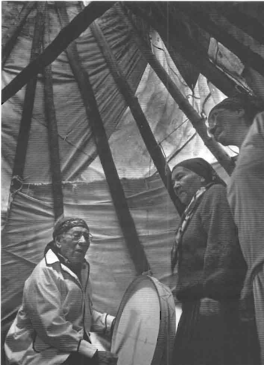
Chaman innu battant le tambour sacré.

Ces réseaux régionaux de troc n'ont jamais vraiment entravé le mode de vie et les valeurs des chasseurs-collecteurs. Avec l'émergence de circuits commerciaux beaucoup plus vastes, comme au XVI e siècle pour la traite des fourrures du Canada, les chasseurs-collecteurs entrent par contre dans un long parcours jalonné de violences et de déracinements.