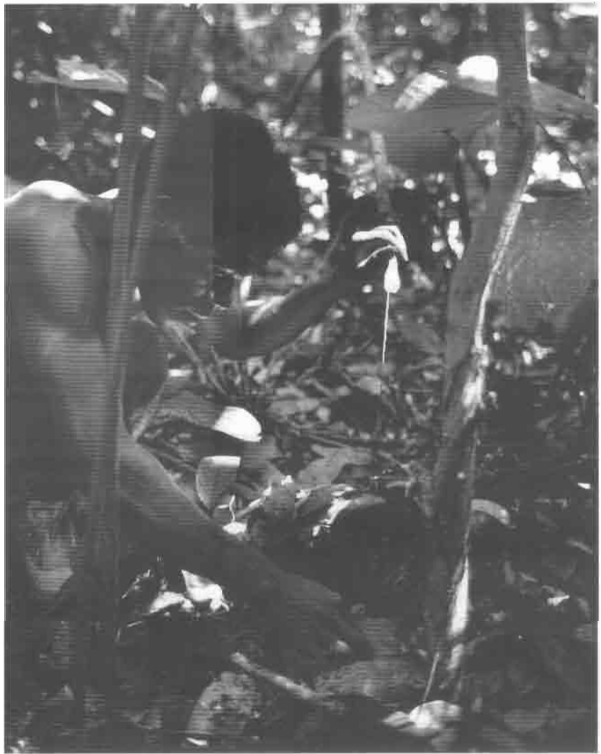
Pygmée posant un piège.

Les chasseurs-collecteurs occupent des environnements très diversifiés mais généralement impropres ou peu propices à l'élevage et à l'agriculture : désert pour les Bochimans d'Afrique australe ou les Aborigènes australiens, forêt tropicale pour les Pygmées d'Afrique centrale, les Négritos d'Asie du Sud-Est ou les Indiens d'Amazonie, milieu arctique et subarctique pour les Esquimaux ou