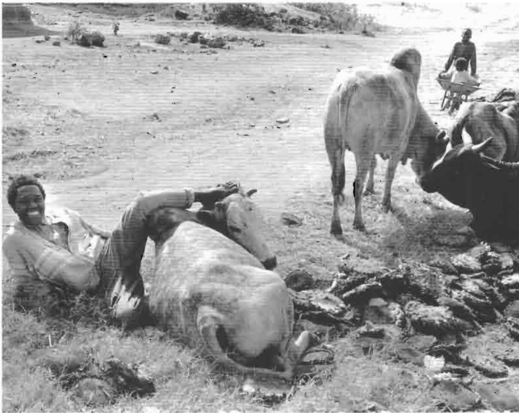
Animal domestique-animal familier (Barabaig).

steppes a favorisé ailleurs une exploitation plus intensive pour le lait et l'introduction de techniques de monte et d'attelage.