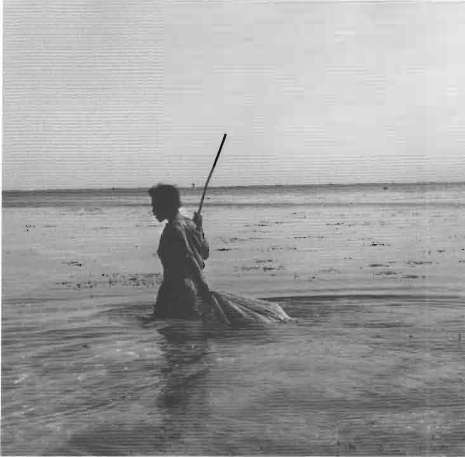
Collecte à marée basse (Vezo).

plusieurs dizaines de milles vers des îlots ou des points de la côte réputés pour la grande richesse de leurs fonds coralliens. Puis, avec le retour des pluies et des cyclones, les pirogues reviennent vers les « plages d'attache » où les familles se rapprochent en installant leurs campements à l'abri des dunes. Le poisson séché est échangé dans les villages de cultivateurs contre du manioc et du maïs, les déplacements pour la pêche sont plus limités et les hommes en profitent pour tailler de nouvelles pirogues dans les forêts voisines. C'est aussi le moment où tous participent aux cérémonies dédiées aux divinités dont dépendent le succès et le bonheur des hommes lorsqu'ils vogueront à nouveau au loin sur la mer nourricière.