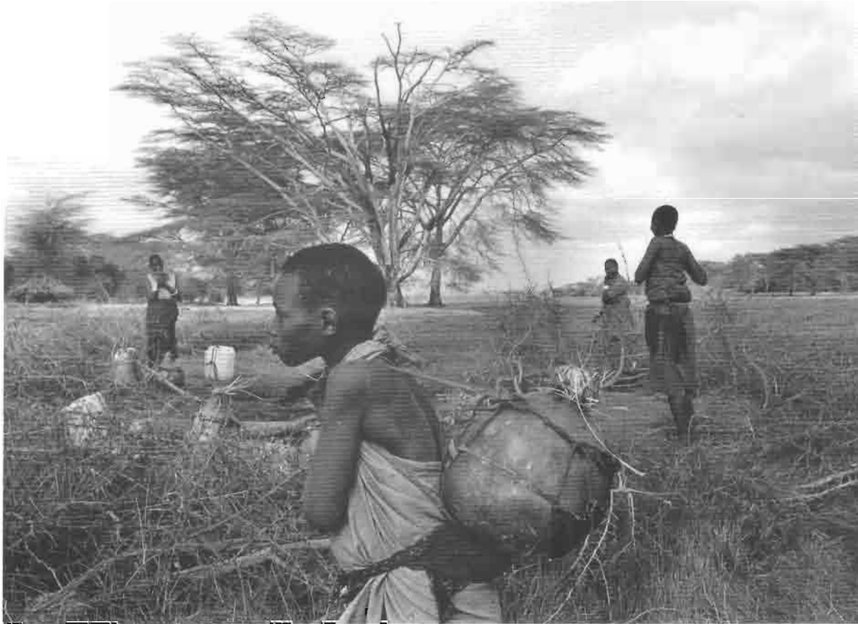
Femmes barabaig au puits.

remplacés par des bovins dans les zones moins sèches du Sahel par exemple, et sur les ovins et les caprins. L'agriculture – sous pluie ou d'oasis – est cependant loin d'être marginale. Nous sommes dans le monde des tribus, groupes liés par une idéologie commune, en ligne paternelle chez les Bédouins, maternelle chez les Touaregs ou les Béja du Soudan, et fortement endogames. L'appartenance à ces tribus conditionne l'accès à l'eau et aux pâturages, ainsi que la sécurité des troupeaux. Ces tribus sont de taille extrêmement variable, quelques centaines à quelques dizaines de milliers de personnes, et plus ou moins hiérarchisées; fortement égalitaires dans la majorité des cas, elles peuvent se prêter aussi à une forte stratification sociale et à l'émergence de formations politiques du type des émirats du Sahara occidental ou de la péninsule arabique.