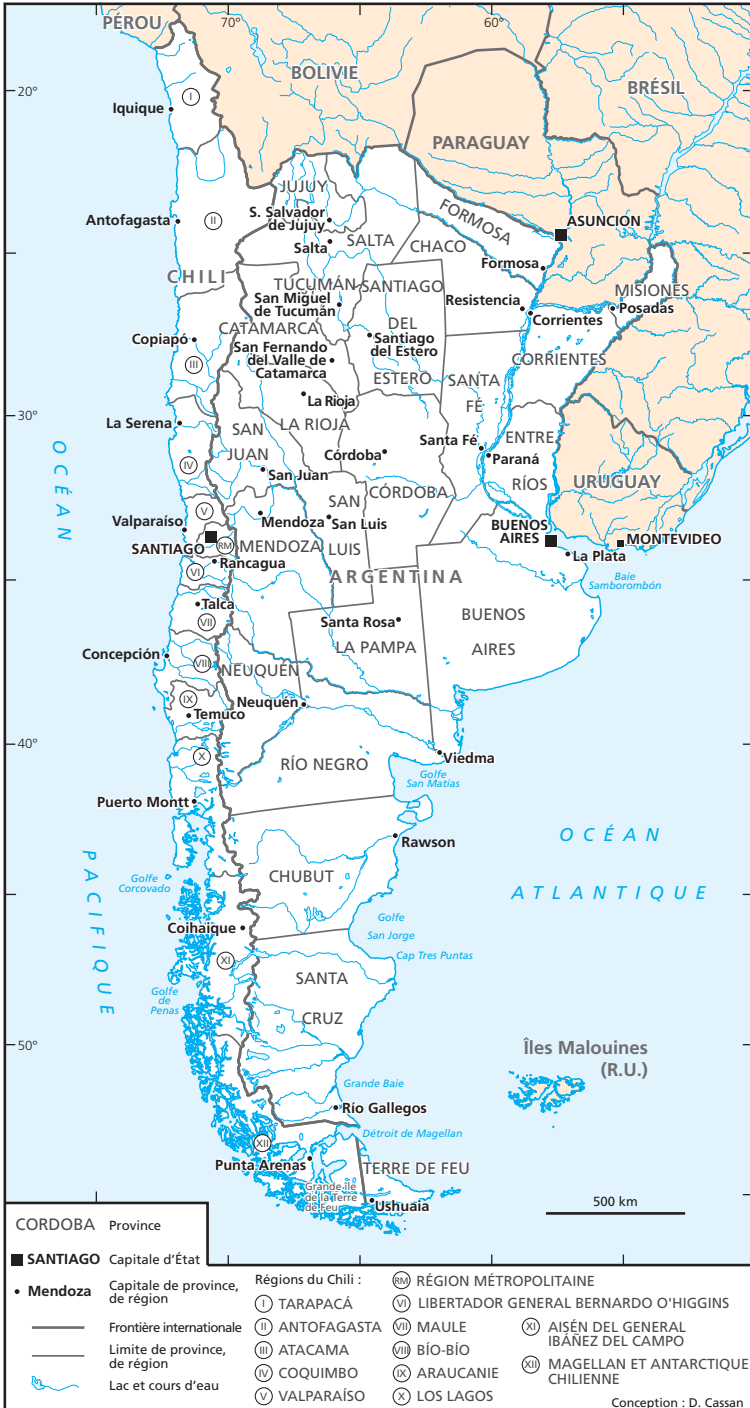
Carte de situation 7. Cône Sud.