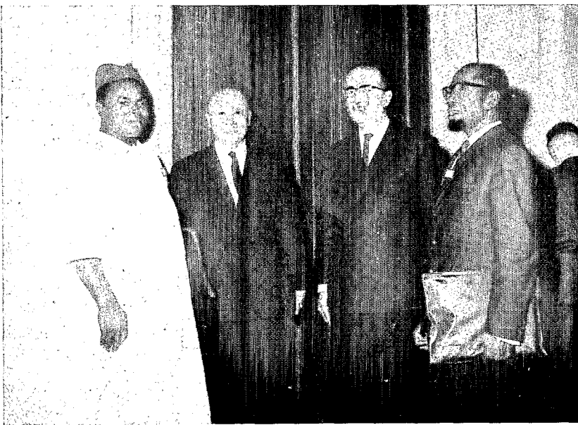
Deuxième Congrès de la Protection des Cultures Tropicales de Marseille.

De même un pulvérisateur pneumatique d'une centaine de chevaux est un appareil coûteux et fragile, qui ne demeurera longtemps utilisable qu'entretenu par un mécanicien compétent et consciencieux et utilisé par du personnel qualifié, et dont l'utilisation ne sera efficace et économique que si le calendrier des traitements est préparé jour par jour à l'avance, si les approvisionnements nécessaires sont amenés à temps. Toutes ces conditions demandent une organisation centralisée, que ce soit au stade d'une Station régionale ou d'un