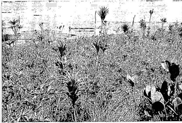
Maquis ligno-herbacé à Costularia nervosa (Cypéracées), Dracophyllum ramosum (Epacridacées). Pente du Pic du Pin, Plaine des Lacs, 300 m.

Ligneous-herbaceous maquis with Costularia nervosa (Cyperaceae), Dracophyllum ramosum (Epacridaceae). Slopes of Pic du Pin, 300 m altitude.