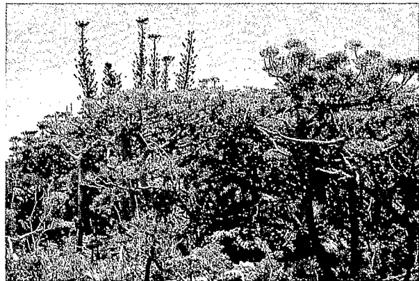
Forêt dense humide sur roches métamorphiques, surcimée par Agathis montana (Araucariacées), au premier plan, et par Araucaria schmidii (Araucariacées), au second plan. Sommet du Mont Panié, 1 650 m d'altitude.

Parmi elles figurent une grande partie des bois exploitables du Territoire : 5 espèces d' Agathis (kaori) et 13 d' Araucaria , 14 espèces de Podocarpacees : Acmopyle , Dacrycarpus , Falcatifolium , Parasitaxus , Prumnopitys (1 espèce chacune),