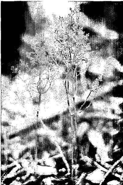
Daenikera corallina (Santalacées), espèce parasite. Sous-bois de forêt dense humide, Parc de la Rivière Bleue, 250 m d'altitude.

Les Dicotylédones sont les plus nombreuses, avec le taux d'endémisme le plus élevé. Les Ptéridophytes pourtant moins nombreuses que les Monocotylédones ont un taux d'endémisme qui leur est légèrement supérieur. Les Gymnospermes ainsi que certaines familles d'Angio-