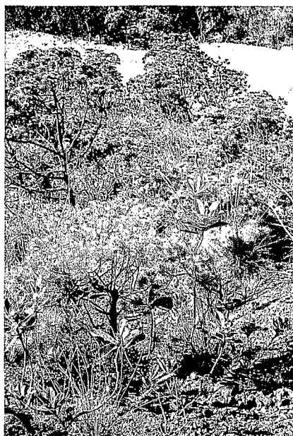
Peuplement de Gymnostoma chamaecyparis sur sol brun hypermagnésien dans la région de Kouaoua.

Gymnostoma chamaecyparis formation on brown hypermagnesian soil (hypermagnesian inceptisol) in the region of Kouaoua.