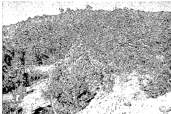
Peuplement de Gymnostoma deplancheanum sur sol ferrallitique ferritique dans la région de la Plaine des Lacs (Massif du Sud). A stand of Gymnostoma deplancheanum on ferrallitic ferritic soil (Oxysol) in the Plaine des Lacs region (Southern Massif).

Gymnostoma chamaecyparis , G. deplancheanum , G. leucodon et G. poissonianum sont localisés exclusivement sur les massifs de roches ultramafiques, encore appelés localement « terrains miniers » en raison de la présence de minerai de nickel. G. intermedium est aussi, à une exception près, cantonné à ces substrats. Il a été signalé une seule fois sur substrat différent, à une altitude de 950 m (échantillon d'herbier de