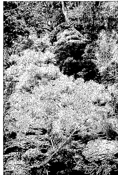
Gymnostoma nodiflorum sur la berge d'un affluent de la rivière Tiwaka.

Les teneurs en Ca, en K et en Mg des quatre Casuarinacées sont relativement basses, inférieures ou sensiblement égales à celles des Dicotylédones de forêt sur roches ultramafiques. L'inverse s'observe pour les teneurs en N et en P de C. collina et de G. nodiflorum , ainsi que pour les teneurs en Na de cette dernière espèce qui est la