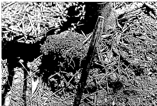
Nodosité actinorhizienne sur racines de Gymnostoma deplancheanum . Actinorhizian nodosity on roots of Gymnostoma deplancheanum.

végétaux ouverts (maquis ou maquis paraforestiers) ou de lisière (formations ripicoles ou cicatricielles).