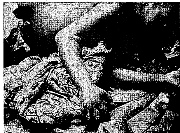
Figure 2. Morsure d'Echis ocellatus : noter l'œdème de la main et de l'avant-bras (stade 2) et surtout la phlyctène au pli du coude traduisant une hémorragie (stade 4). Echis ocellatus bite: note the oedema of the hand and forearm (stage 2) and especially the phlyctena at the elbow signifying hemorrhaging (stage 4).

modification apportée à la méthode de WARRELL et al. (13) qui attendent 20 minutes seulement, la présence et la qualité du caillot ont été observées en agitant doucement le tube. L'absence de caillot ou un caillot friable et partiel traduit un trouble de la coagulation.