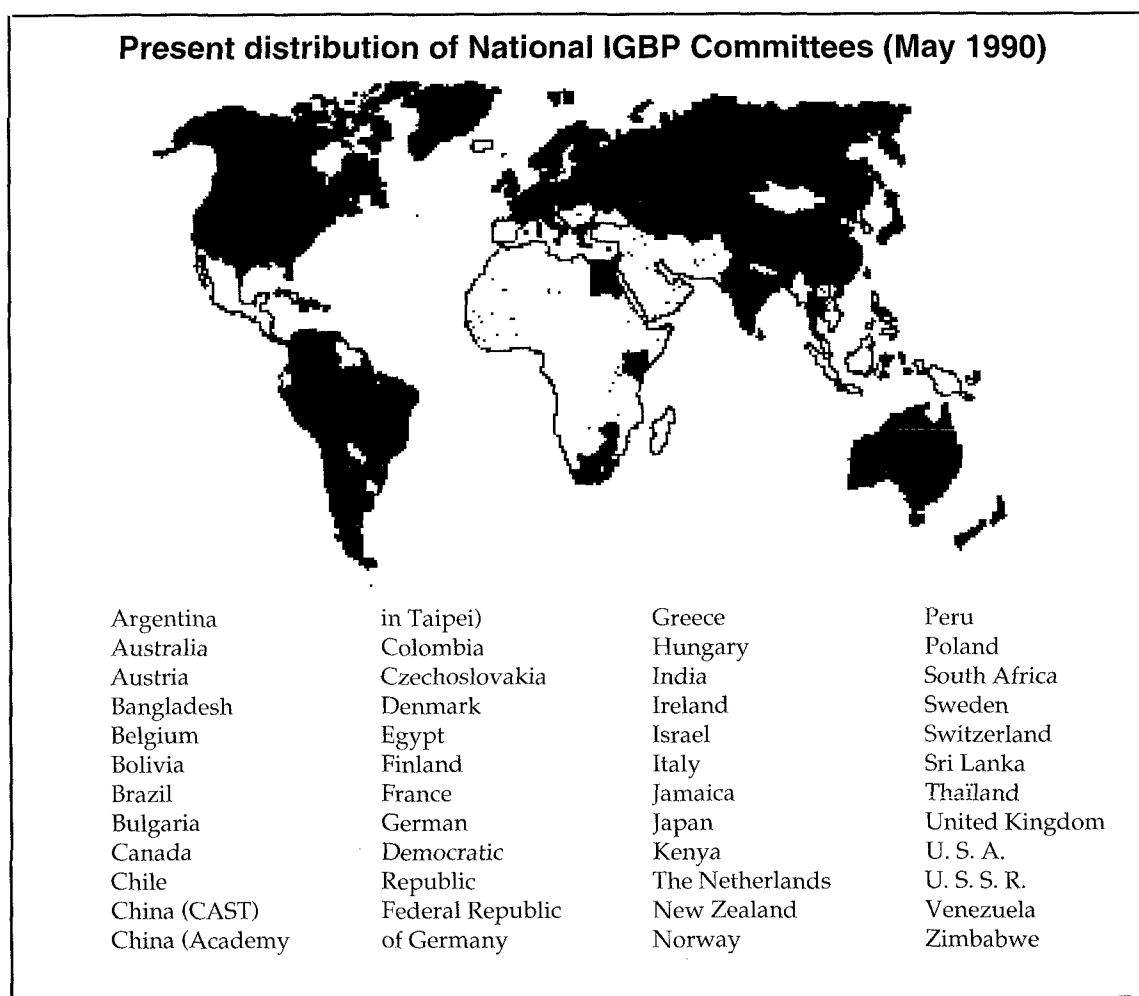
Fig. 1. L'insertion des pays africains dans les grands programmes : exemple du Programme international sur la géosphère et la biosphère. IGBP-Global change (rapport n° 12, 1990).

Il a été fait remarquer dans les précédents paragraphes, que ces programmes de surveillance et d'acquisition de données sur le long terme entraînent l'intégration aux grands programmes mondiaux. La fig. 1 montre par exemple la distribution géographique des comités nationaux du Programme International sur la Géosphère et la Biosphère (PIGB) : quelles instances nationales ou régionales africaines peuvent et doivent assurer la concertation entre organisations internationales, structures intergouvernementales, ONG, chargées de ces grands programmes?